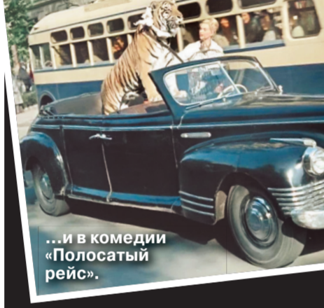
...и в комедии «Полосатый рейс».

Справедливости ради следует упомянуть, что данный фатон засветился еще в нескольких фильмах, например в финальной сцене комедии «Полосатый рейс»: он везет по московским улицам укротительницу с одним из ее тигров. Столь богатая филография отнюдь не удивительна. Ведь «зисок» то мосфильмовский. Правда, его основная работа — быть киносьемочной машиной (кстати, соответствующую надпись можно прочитать на двери якинского «ЗиСа»). Именно на таком автомобиле без жесткой крыши удобно передавать режиссеру при съемках динамичных массовых сцен, руководя (в том числе и жестами) процессом. А порой в фатоне, который изготовлен на основе правительственного лимузина и обладает великолепной плавностью движения, даже располагался оператор со своей кинокамерой, чтобы снимать эпизод на ходу. Естественно, сам автомобиль при этом в кадр не попадал. Ну а упомянутые сцены с его участием — фактически «работа по совместительству».