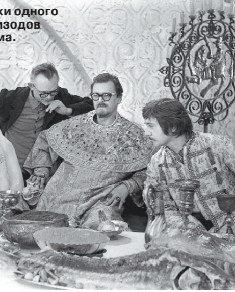
Съемки одного из эпизодов фильма.