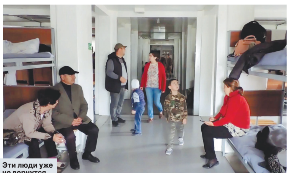
Эти люди уже не вернутся домой.

Третья карабахская война длилась один день Власти Нагорного Карабаха объявили о прекращении огня и роспуске армии. Карабах сдан. Мы выяснили, кто теперь станет с жителями Степанакерта, которые все еще остаются в городе в подвалах. Что будет с Ереваном, где вчера весь день проходили протесты.