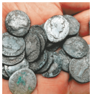
связи с центрами античной цивилизации в средней полосе России не было обнаружено.

В Калужской области археологи регионального объединенного музея-заповедника при раскопках обнаружили клад из римских серебряных денариев I—III веков нашей эры. На монетах отчеканены профили римских императоров Антонина Пия, Марка Аврелия, Траяна и Септимия Севера.