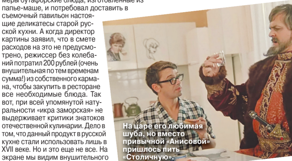
На царя его любимая шуба, но вместо привычной «Анисовой» пришлось пить «Столичную».

В качестве оценочного критерия — насколько это внушительные суммы — напомним, что автомобиль «Жигули» ВА3-2101, заветная мечта многих артистов в то время, стоил в магазине 5620 рублей.