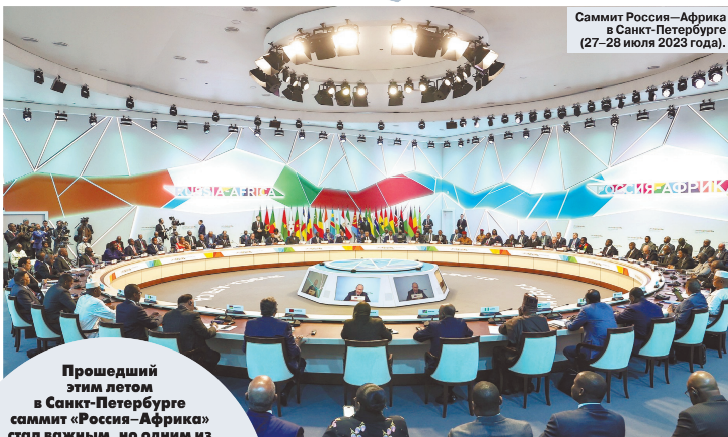
Саммит Россия—Африка в Санкт-Петербурге (27–28 июля 2023 года).