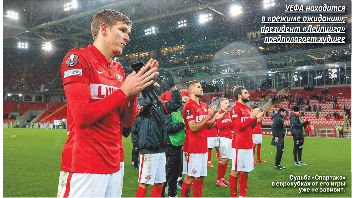
УЕФА находится в режиме ожидания, президент «Лейпцига» предполагает худшее