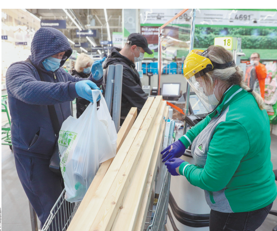
Александр Павлов / ТАСС