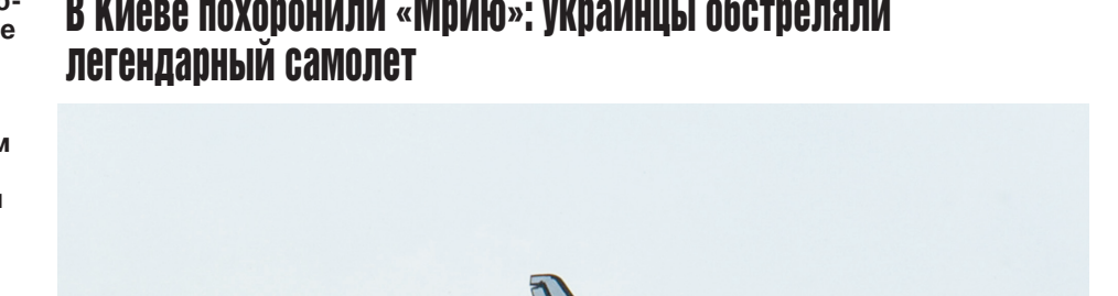
Ан-225 в аэропорту Гостомель.

В Киеве похоронили «Мрию»: украинцы обстреляли легендарный самолет