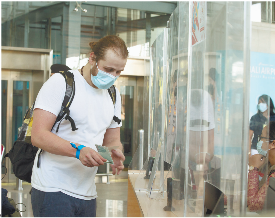
Авиапассажиры в аэропорту.

Туристы, которые улетели отдохнуть на каникулы в Европу и государства Карибского бассейна, оказались в ловушке. Представители туротрасли надеются, что всех застрявших за границей туристов удастся вывезти домой, но как и когда — пока неясно.