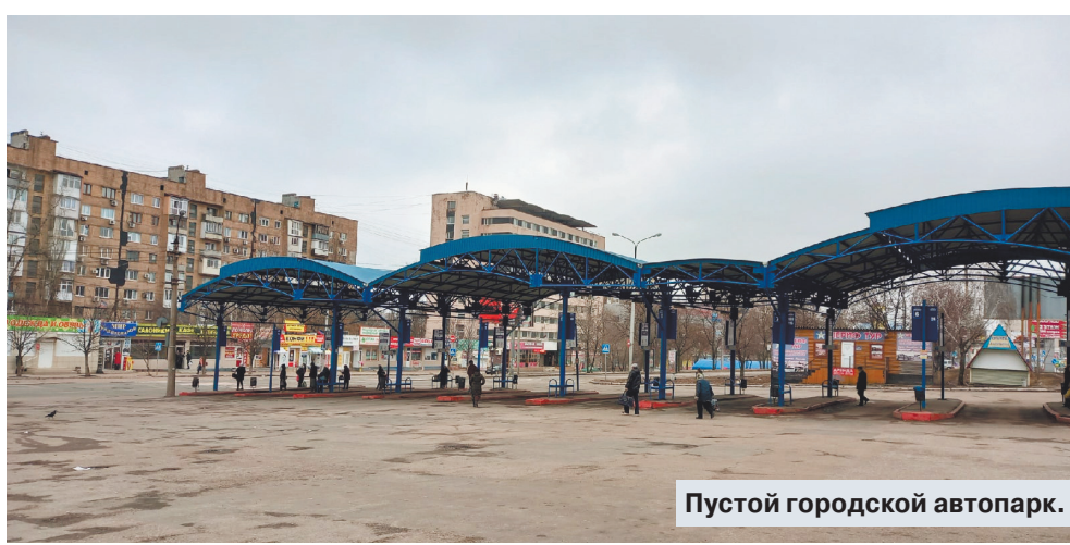
Пустой городской автопарк.

Каждое утро работающего дончанина начинается не с кофе. А с переключки: какой транспорт ходит? В столице ДНР уже неделю продолжается транспортный коллапс. И ситуация ухудшается с каждым днем. Всею причиной всеобщая мобилизация. Сегодня вроде глава ДНР Денис Пушилин сообщил, что мобилизация приостанавливается, потому что необходимо количество людей уже набрано. Вот только мужчин в городе почти не видно.