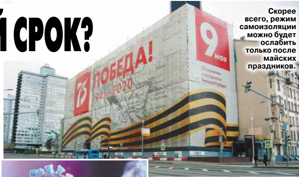
Скорее всего, режим самоизоляции можно будет ослабить только после майских праздников.