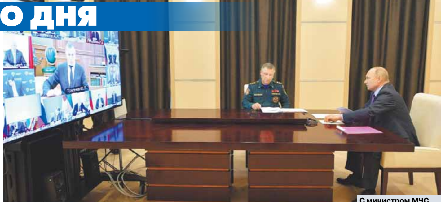
С министром МЧС Евгением Зиниченко.

Коронавирус в каком-то смысле отбросил современный российский политический календарь на несколько столетий тому назад. Из политически благоприятного периода поздняя весна превратилась в проблемный. Российская власть лицом к лицу сталкивается сейчас с целым рядом схожих «разрывов». Представьте себе: вы переплываете бурную реку, боретесь с сильным течением, избегаете несущихся на сумасшедшей скорости катеров, считаете каждый метр, который остался до вожделенного другого берега. Наконец, вы его достигае. И тут вам объявляют: спасибо за ваши героические усилия! Но вам надо сию же минуту плыть обратно! С моей точки зрения, эта метафора довольно точно описывает состояние многих из нас после четырех недель строгого карантина. Еще в конце марта известный в прошлом