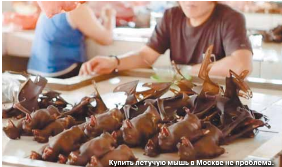
Купить летучую мышь в Москве не проблема.

Главными подозреваемыми в заражении людей коронавирусом называются: летучие мыши (геном вируса азиатских подковоносцев на 96% совпадает с геномом «короны»...)