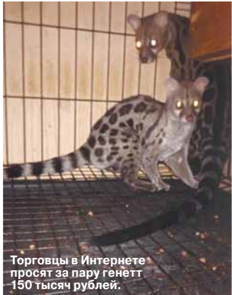
Торговцы в Интернете просят за пару генетт 150 тысяч рублей.

Чтобы узнать, так ли это на самом деле, мы поговорили с этническими китайцами, вьетнамцами, специалистами по азиатской культуре и россиянами, жившими в Поднебесной. Спойлер: всех этих потенциально опасных зверей едят люди. Причем не только в Китае, но и за пределами. Например... в Москве.