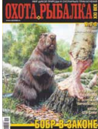
БОБР В ЗАКОНЕ

«Оружие» Оружие или нет? — разбираемся в особенностях оборота пневматики. Моссберг рвется в спорт — презентация нового ружья. Первый полуавтомат — «Винчестер мод. 1903 года» в руках эксперта. «Природа» Бобр в законе — казнить или помиловать? Медвежьи блохи — не примеряй чужую шкуру на себя. Иду на добычу — школа выживания в условиях карантина.