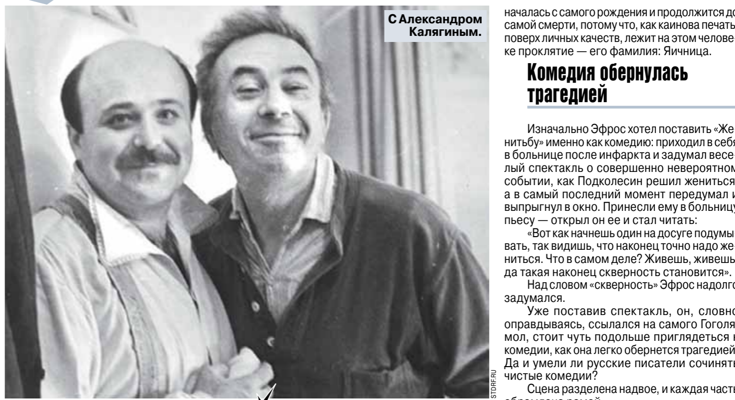
С Александром Калягиным.