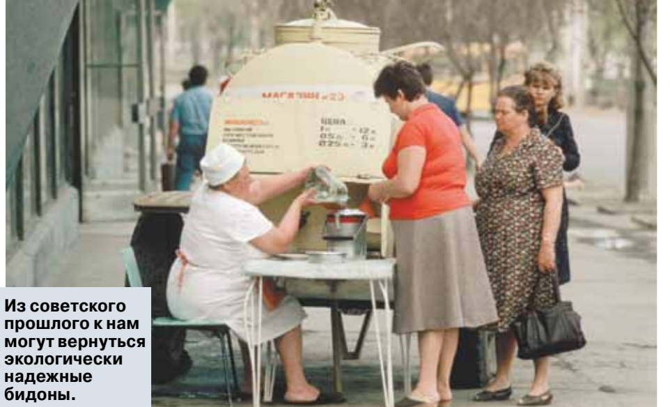
Из советского прошлого к нам могут вернуться экологически надежные бидоны.