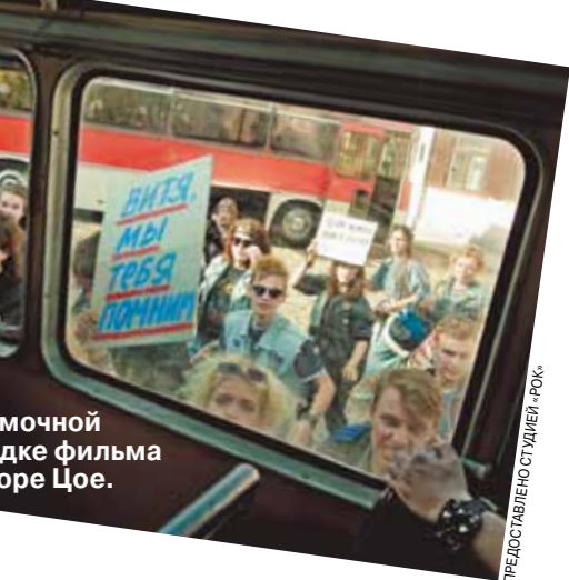
На съемочной площадке фильма о Викторе Цое.