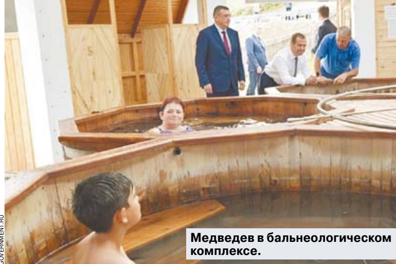
Медведев в бальнеологическом комплексе.

Дмитрий Медведев окончательно похоронил надежды Синдзо Абэ в обозримой перспективе подписать мирный договор с Россией. В пятницу премьер после 4-летнего перерыва, на который пришелся расцвет российско-японских отношений, посетил один из Южно-Курильских островов — Итуруп. В Токио уже заявили, что эта поездка негативно скажется на переговорном процессе по договору и осложнит намечающуюся в начале сентября встречу Путина и Абэ.