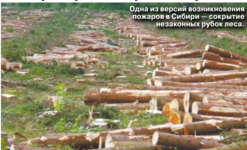
Одна из версий возникновения пожаров в Сибири — сокрытие незаконных рубок леса.

С пожарами решили справиться при помощи уголовных дел