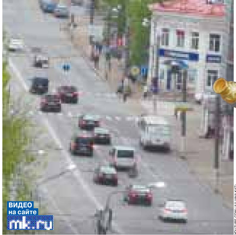
ВИДЕО на сайте mk.ru

Кортеж патриарха насчитывает 13 машин. «Скорая помощь» на фото не поместилась.