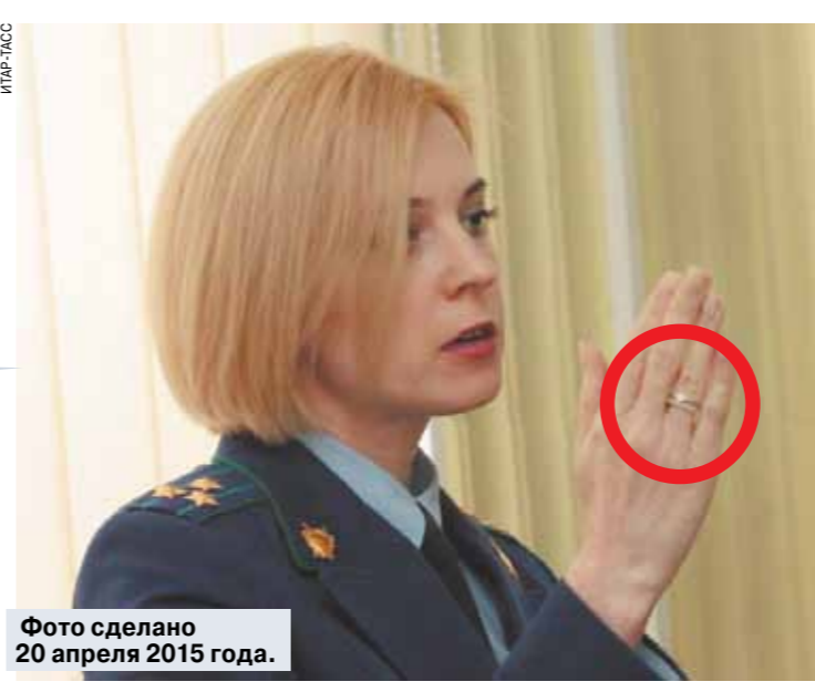
Фото сделано 20 апреля 2015 года.