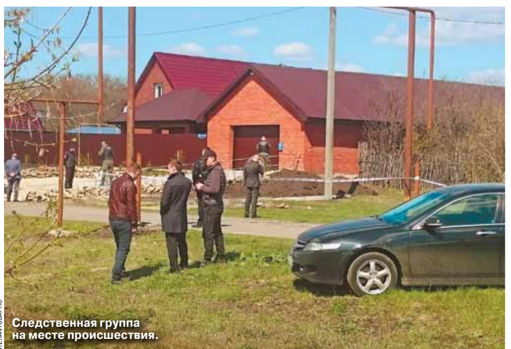
Следственная группа на месте происшествия.

Жуткое убийство семьи полковника полиции — месть поволжской братвы?