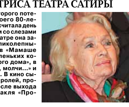
УМЕРЛА СТАРЕЙШАЯ АКТРИСА ТЕАТРА САТИРЫ Менглетом, которого потеряла в день своего 80-летия, после чего считала день рождения «днем со слезами на глазах». В театре она запомнилась великими образами в «Мамаше Кураж», в «Маленьких комедиях большого дома», в «Молчи, грусть, молчи...» и других работах. В кино сыграла более 30 ролей, прославившись после выхода фильма-спектакля «Пронись и пой».

Надежды россиян вернуть деньги, потраченные на взятку чиновником, развеяла высшая судья. Даже если государственного мужа осудят за мздоимство, все имущество конфискуют, то ни рубля из этого взяткодатель не получит.