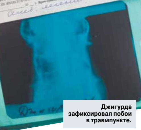
Джигурда зафиксировал побои в травмпункте.