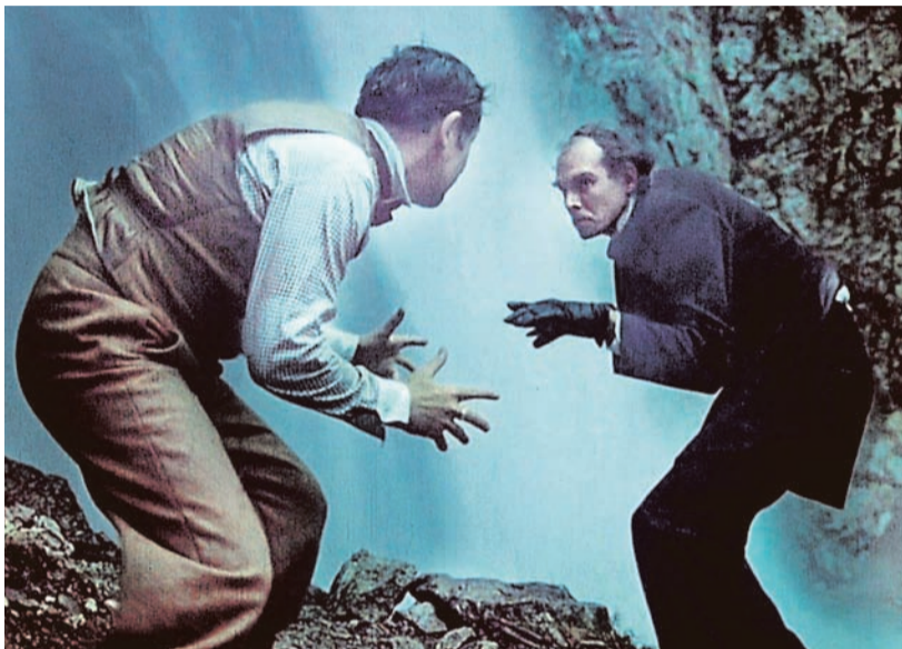
«ПРИКЛЮЧЕНИЯ ШЕРЛОКА ХОЛМСА И ДОКТОРА ВАТСОНА»