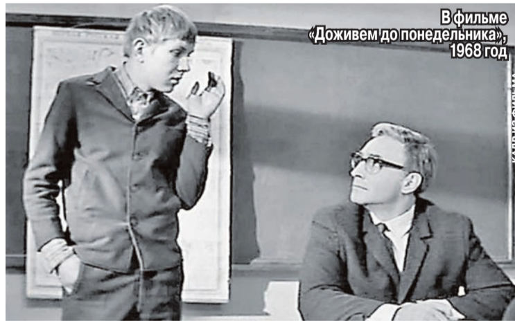
В фильме «Доживем до понедельника», 1968 год

ные встречи со зрителями. Вячеслав Васильевич уже тогда был немного закрытый, не очень любил общаться, но меня он спрашивал, кто родители, где учишься... Кстати, картина «Семнадцать мгновений весны» тогда еще не вышла, а вот когда он сыграл Штирлица, то, конечно, и вовсе закрылся. Ему сильно надоедали с анек-