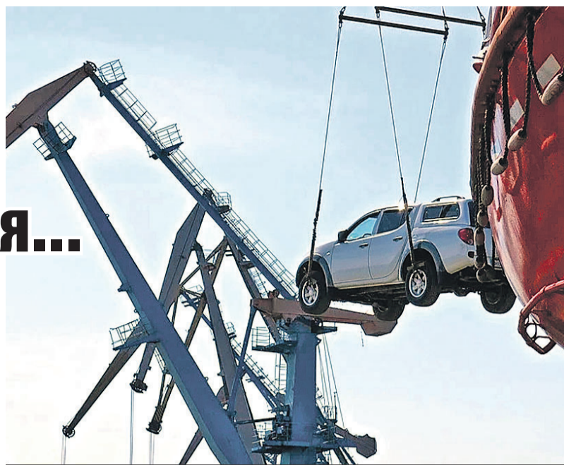
Покупка автомобиля в условиях санкций - дело непростое.

Дилеры столкнулись с ситуацией, когда машины, завезенные в марте, в перерасчете на текущий курс доллара серьезно прибавили в цене. Поэтому возник ажиотажный спрос на