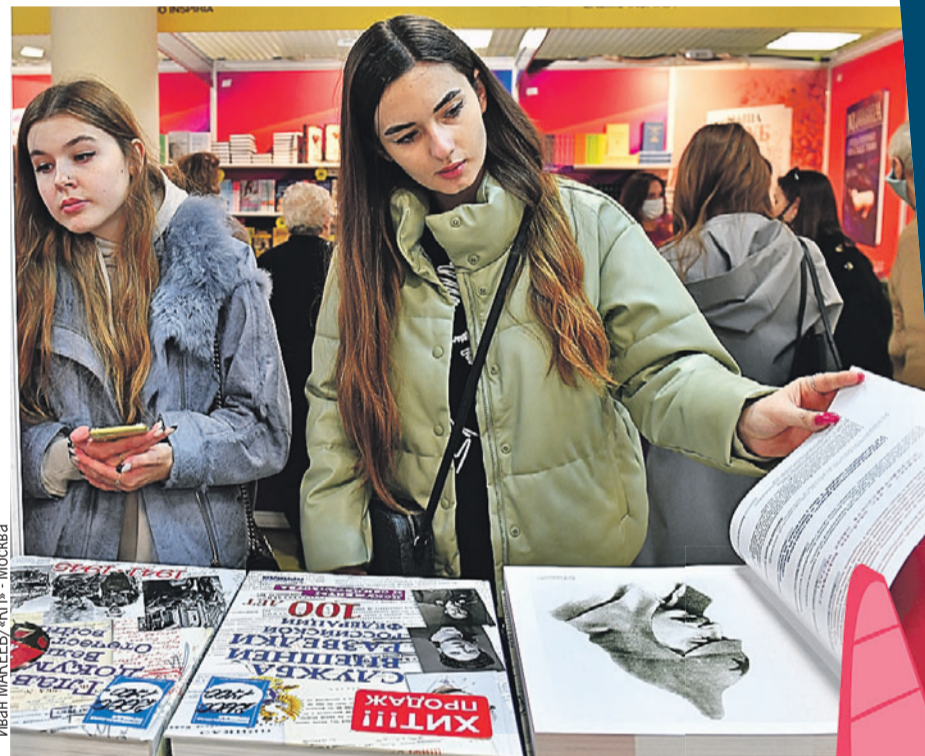
Иван Макеев/«КП» - Москва

А до окончания конкурса еще целый месяц! И уже 50 работ вышли во второй тур. Они опубликованы на сайте конкурса и участвуют в народном голосовании, которое определит лидеров для экспертного жюри. А мы задались вопросом: если у нас в стране так много начинающих талантливых авторов, будет ли на них и их тематику читательский спрос? И почему молодежь больше пишет не про любовь, а уходит в антиутопию, фэнтези, темы патриотизма и военных конфликтов? Об этом мы поговорили с нашими экспертами. И оказывается, нет худа без добра - западные санкции отразились на книжном рынке России. Они освободили ниши для молодых и талантливых, за которыми уже началась «охота» российских книгоиздателей.