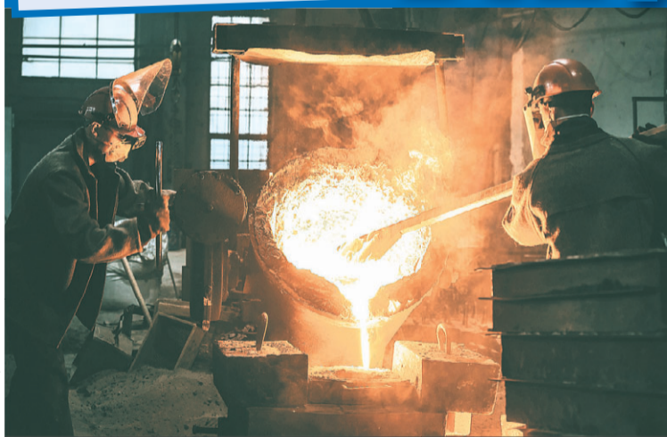
Самым эффективным оказался литейный цех, где расплавленный металл переливают в формы.