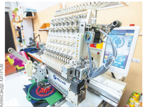
Одноголовая машина способна вышить любой узор.

Также в планах наладить отношения с коррекционной школой-интернатом, чтобы ребята могли без проблем найти себе занятие и в будущем - работу.