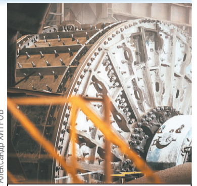
На предприятии на постоянной основе ведется модернизация производства.

Ну, а главное в работе предприятия - люди. Зимой, когда производство менее загружено, на заводе трудится до 1800 человек, а летом - свыше 2000. «Спасскцемент» активно работает со школами и колледжами Приморья, а также ведущими вузами России. На заводе практикуют