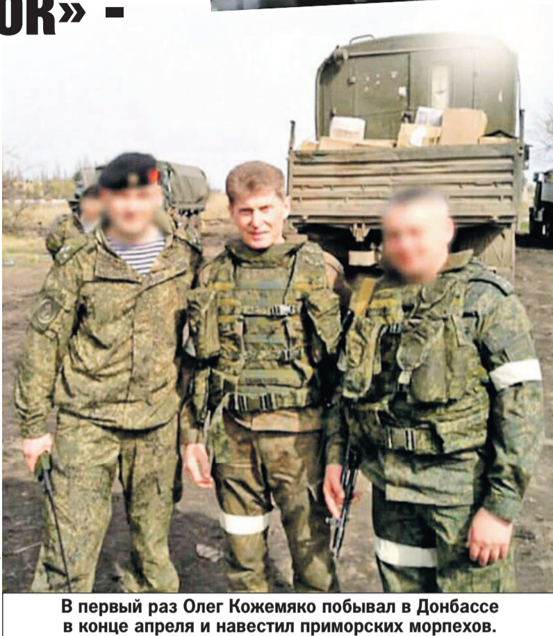
В первый раз Олег Кожемяко побывал в Донбассе в конце апреля и навестил приморских морпехов.

- Да, общественники выходят на то, чтобы помогать в формировании этой систе-