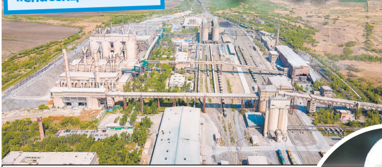
Новоспасский цементный завод с высоты птичьего полета.