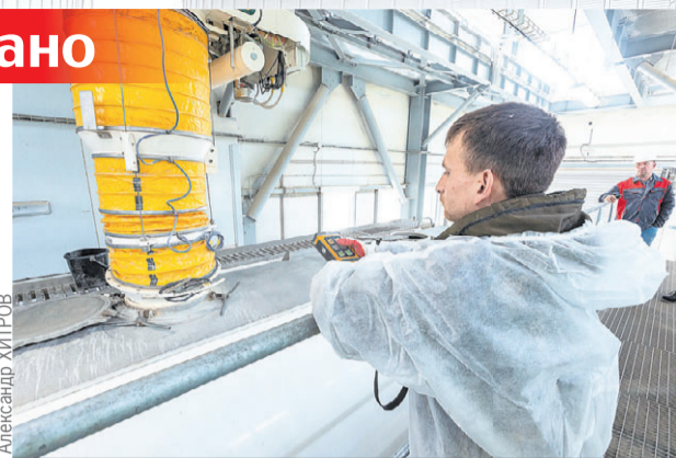
Роботизированная линия отгрузки не имеет аналогов в России.

Что касается автоматизации, на заводе установлена довольно известная роботизированная линия отгрузки, которую запустили в прошлом году на Восточном экономическом форуме. Она не имеет аналогов в России. Помимо этого, используется оборудование от одного из мировых лидеров отрасли - голландской компании. Благодаря отличной