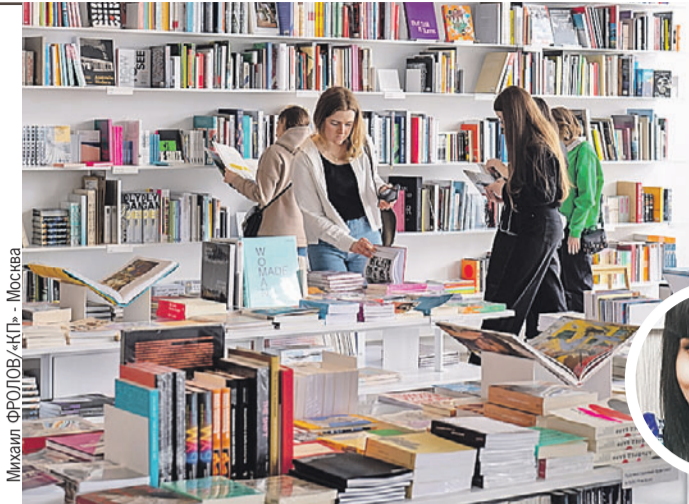
Михаил Фролов/«КП» - Москва

Издатели отмечают, что сегодня молодежная аудитория обеспечивает рост всего сегмента художественной литературы.