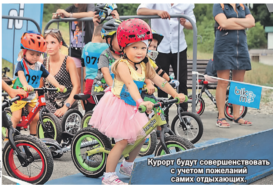
Курорт будет совершенствовать с учетом пожеланий самих отдыхающих.

- «Горный воздух» является жемчужиной Южно-Сахалинска. Поэтому важно сделать так, чтобы курорт пользовался популярностью в любое время года, а не только зимой. К примеру, летом горожане и гости острова могли бы подниматься