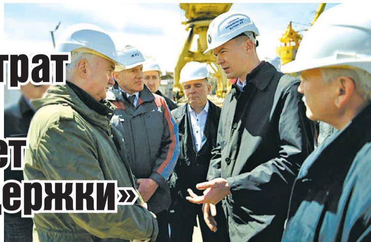
Правительство Хабаровского края

- Существенную роль в промышленном производстве играют предприятия оборонно-промышленного комплекса, которые и фор-