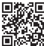
Правительство Камчатского края

Видео из соколиного центра смотрите на сайте dv.kp.ru