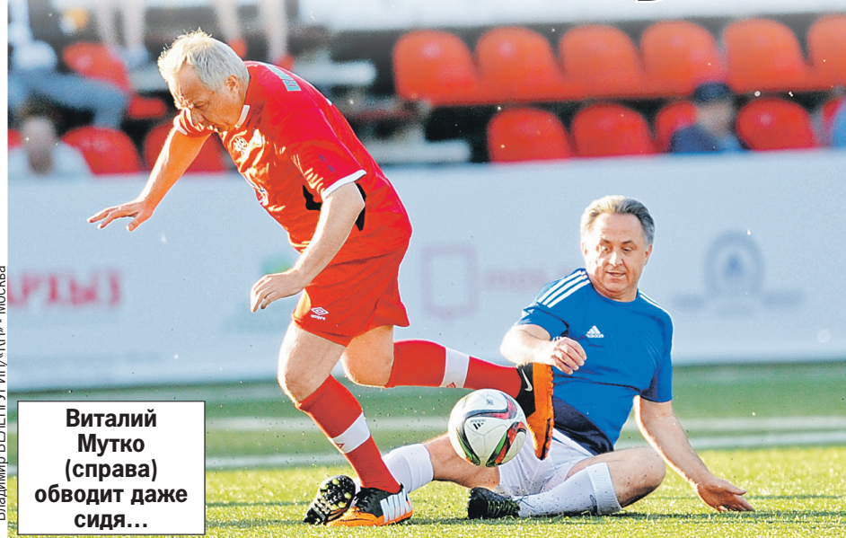
Виталий Мутко (справа) обводит даже сидя...