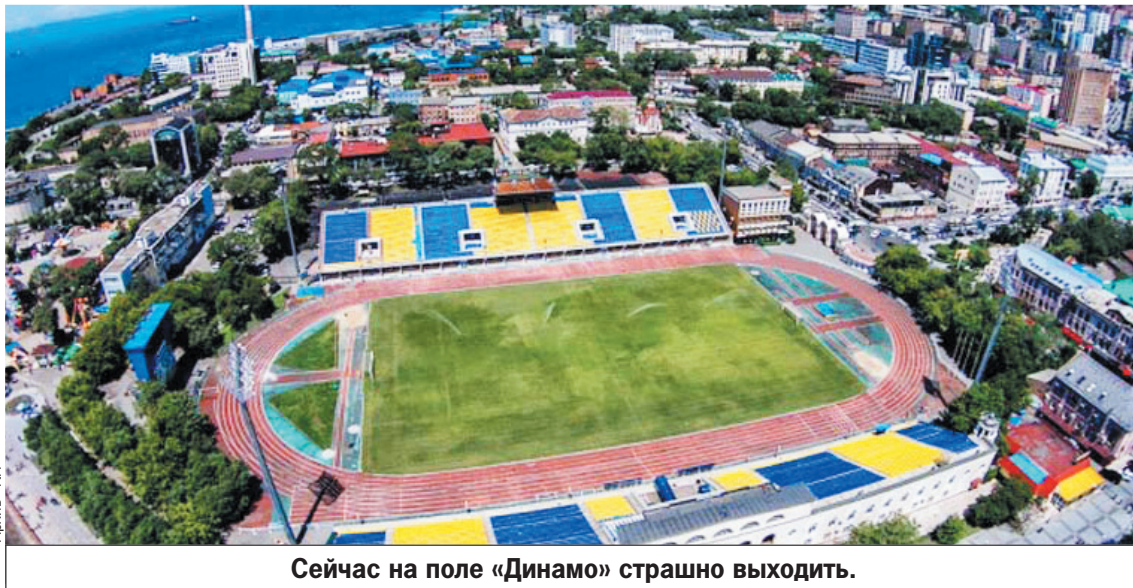
Сейчас на поле «Динамо» страшно выходить.