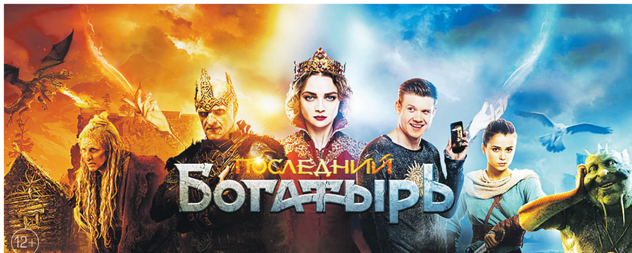
Телепреьера новой сказки «Последний богатырь», уже ставшей блокбастером, - 1 января в 20.30 на телеканале «Россия».

Накануне Нового года кинозрителей ждет еще одна значительная премьера - фильм «Движение вверх», снятый при участии телеканала «Россия 1».