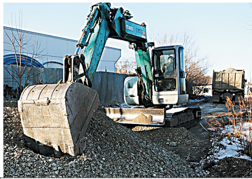
Эту объездную дорогу автомобилисты ждут давно.