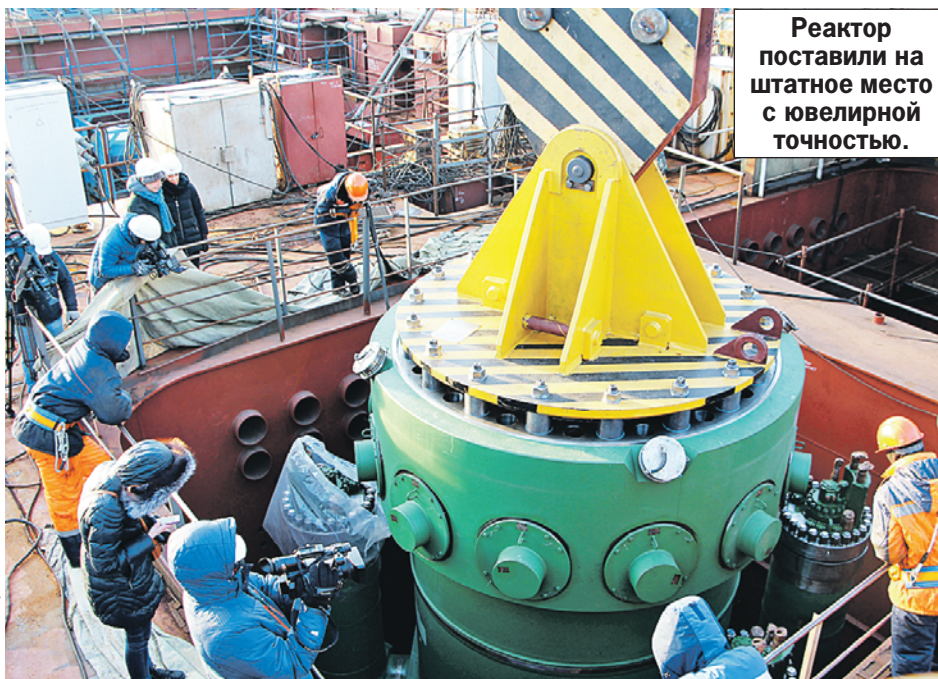
Реактор поставили на штатное место с ювелирной точностью.