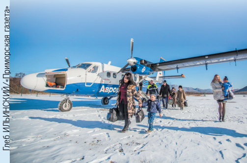
Этот самолет по вместимости как автобус.