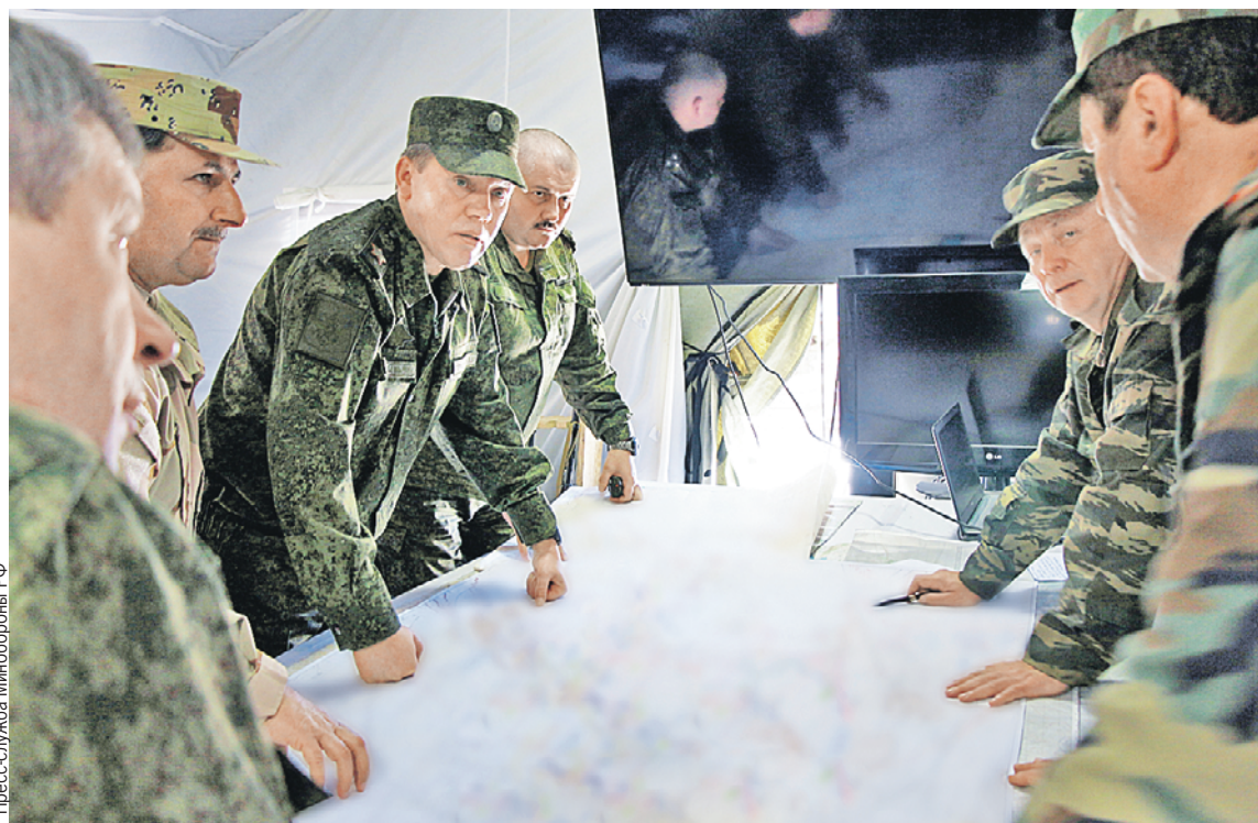
Начальник Генштаба ВС России Валерий Герасимов (на фото - третий слева) постоянно выезжал в Сирию, где доводил до командиров задачи по разгрому боевиков.

Другая важная задача была - организовать управление всеми силами, участвующими в боевых действиях. Для этого был развернут командный пункт нашей группировки в Хмеймиме и пункты управления на направлениях, где ведутся боевые действия.