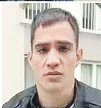
А это владелец красной фуры.