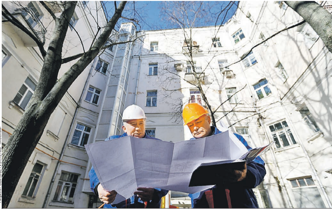
Специалисты жилищной инспекции будут тщательнее следить за качеством ремонта домов. Будем надеяться, что крыши и трубы станут протекать реже.

А теперь подробности (будет сложно, но мы разберемся). Правила расчета пени в этом году меняют уже не первый раз. Предыстория такая. По общему правилу, которое действовало до февраля