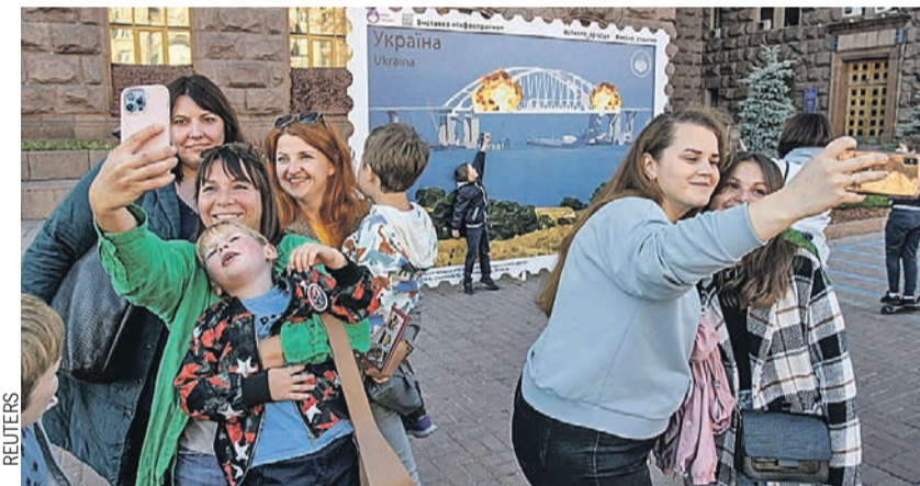
В центре Киева после субботнего взрыва на Крымском мосту жители столицы Украины с улыбками делали селфи на фоне трагической «картинки». Еще не догадываясь, что скоро будет не до смеха... (О том, как отреагировала Россия < стр. 2.)

Водитель первой фуры уже дает показания. Скорее всего, как и шофер второй фуры, он был использован вслепую и не знал о том, что везет.