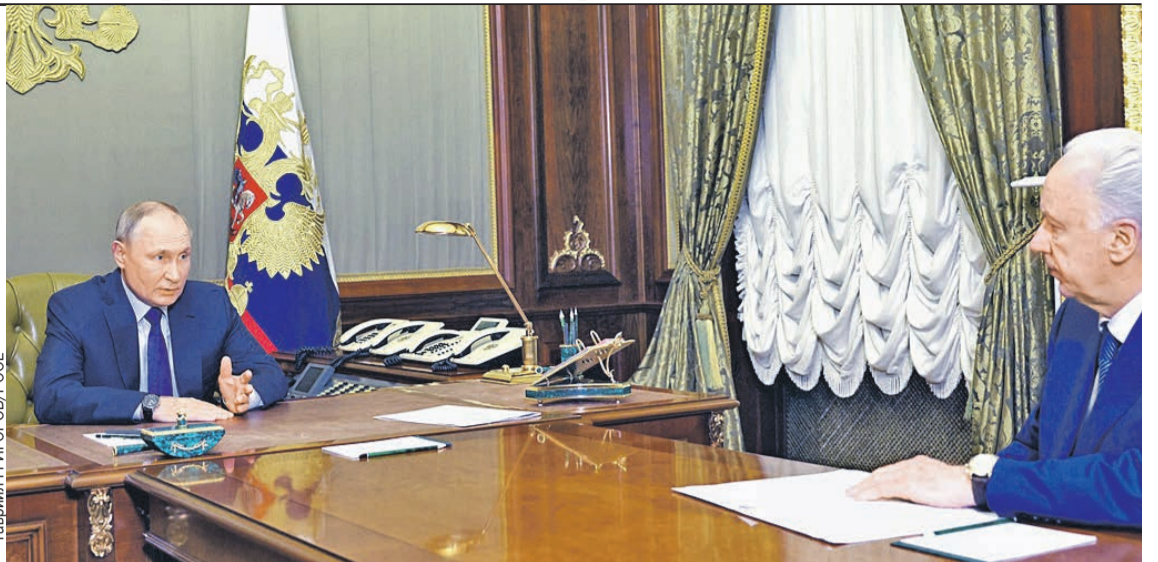
Перед тем как на Украину обрушился удар возмездия, Владимир Путин заслушал доклад главы СК Александра Бастрыкина о расследовании теракта на Крымском мосту.

- Сегодня утром нанесен массированный удар высокоточным оружием большой дальности воздушного, морского и наземного базирования по объектам энергетики, военного управления и связи Украины... В случае продолжения попыток проведения на нашей территории терактов ответы со стороны России будут жесткими и по своим масштабам будут соответствовать уровню угроз, создаваемых Россией. Ни у кого не должно быть никаких в этом сомнений, - пообещал Путин.