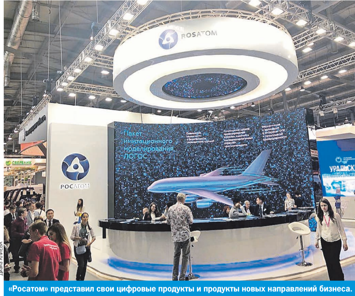
«Росатом» представил свои цифровые продукты и продукты новых направлений бизнеса.

ная для работы с продукцией и документами, имеющими ограничения доступа по типу информации. Система Multi-D - это комплексная цифровая платформа поддержки объектов капитального строительства на полном жизненном цикле, начиная от проектирования и заканчивая сдачей в эксплуатацию.