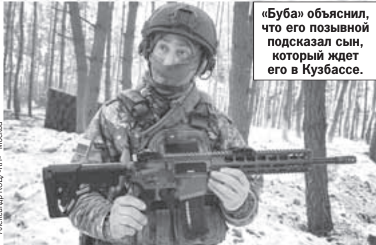
Александр КОЦ/«КП» - Москва

Перед перегонкой в тыл на всякий случай сняли пулемет, а на антенну повесили красные штаны и тельняшку - чтобы не попасть под дружественный огонь. Пулемет на него скоро вернут, и машина еще послужит морпехам 810-й бригады.