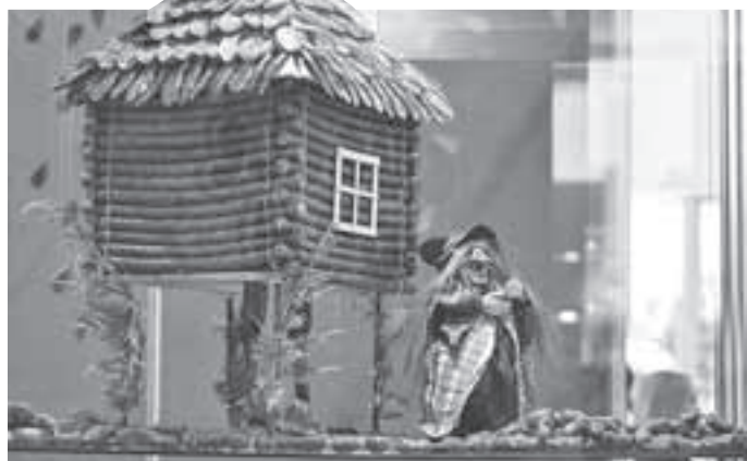
Колбаса - продукт древний и универсальный.