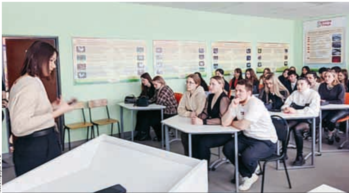
С 2025 года программа «Приоритет-2030» берет курс на технологическое лидерство.

Получателями гранта в Саратовской области стали три вуза. Саратовский национальный исследовательский государственный университет имени Н.Г. Чернышевского и Саратовский государственный университет имени В.И. Разумовского будут участвовать в программе в статусе кандидата с правом отбора на получение государственной поддержки в следующем году.