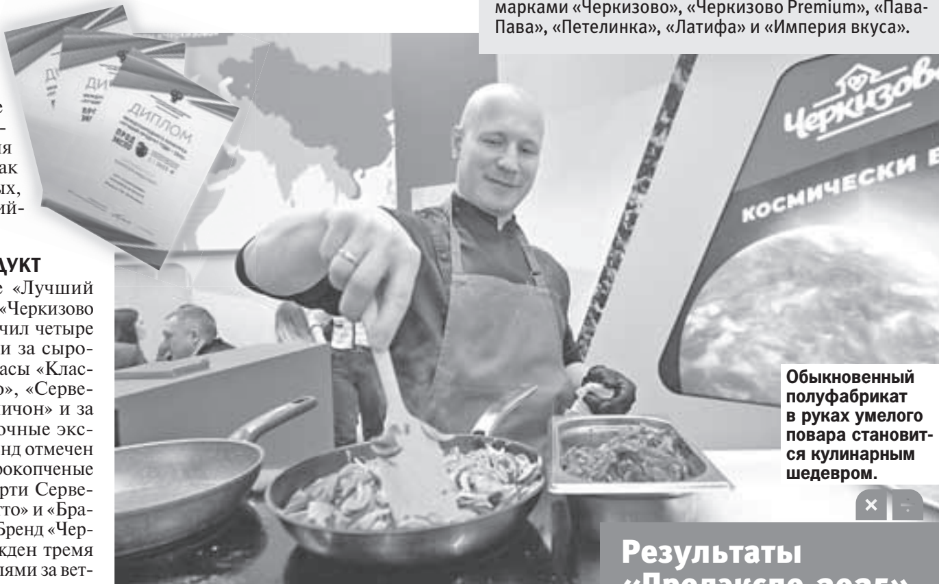
Обыкновенный полуфабрикат в руках умелого повара становится кулинарным шедевром.

Крупнейший российский производитель мяса Группа «Черкизово» на международной выставке «Продэкспо-2025» получила 16 золотых медалей и представила широкий ассортимент своей продукции. В рамках конкурса «Лучший продукт» награды получили мясные изделия компании под марками «Черкизово», «Черкизово Premium», «Пава-Пава», «Петелинка», «Латифа» и «Империя вкуса».