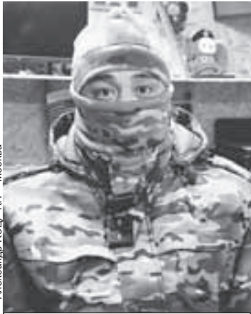
Александр КОЦ/«КП» - Москва

- Всегда страшно. Приходит момент, когда просто нужно это чувство самосо-