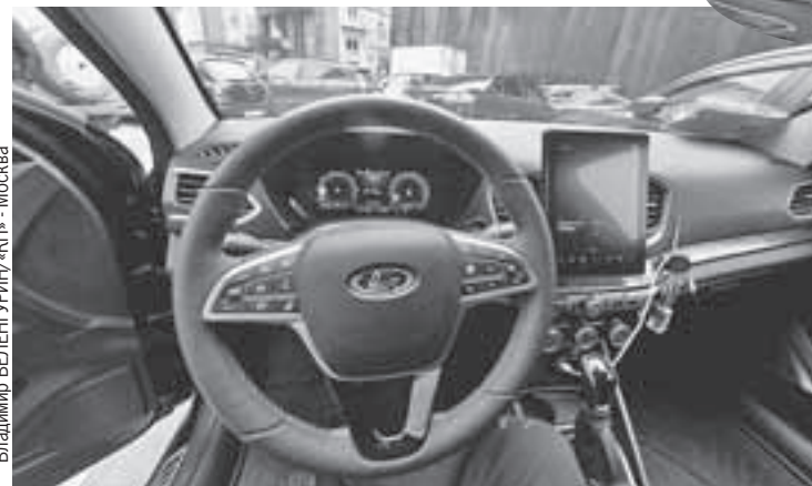
Владимир ВЕЛЕНГУРИН/«КП» - Москва

Багажник вместительный, объемный. Можно хоть на дачу, хоть на рыбалку (конечно, если это личное авто, а не служебное).