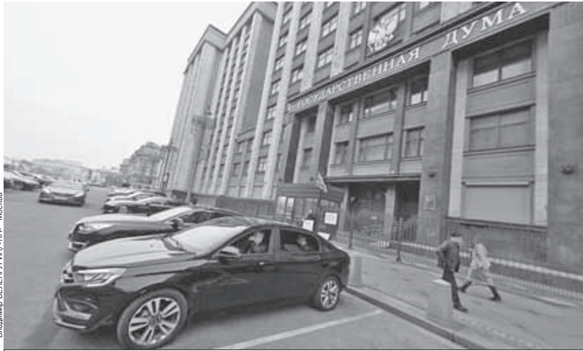
Раньше у главного входа в Думу парковались сплошь иномарки. Теперь много наших - есть и Lada Aura (на первом плане), и Aurus.