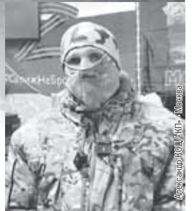
Александр КОЦ/«КП» - Москва

«Буба» объяснил, что его позывной подсказал сын, который ждет его в Кузбассе.