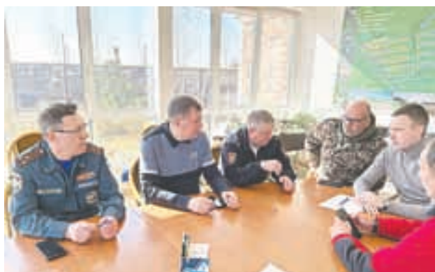
Жителей призывают при обнаружении во дворах осколков БПЛА обращаться в экстренные службы.