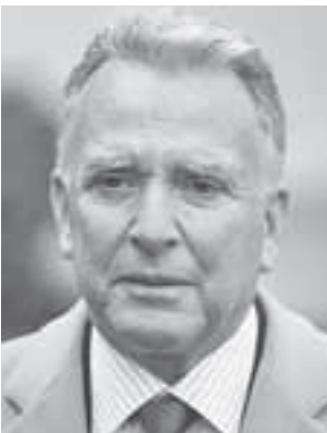
Стив Уиткофф не только нашел общий язык с Владимиром Путиным, но и увез в Вашингтон картину-подарок, которая тронула Дональда Трампа.

- Путин заказал портрет Трампа у ведущего российского художника. По возвращении я передал его президенту. Об этом даже написали в газетах. Это был очень благородный и красивый момент. Трамп был тронут, - вспомнил он.