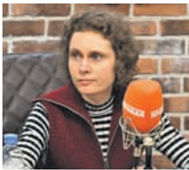
Иван МАКЕЕВ/«КП» - Москва