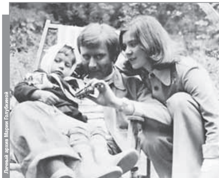
Андрей Миронов, Лариса Голубкина и маленькая Маша. Недавно Мария Голубкина заявила, что актер был ее родным отцом, а не отчимом.

ее, осыпая самыми унизительными словечками... В общем, возни с Ларисой хватало, но, слава Богу, у нее оказался ровный, необидчивый характер».