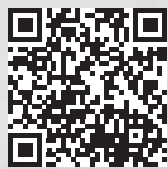
Фото присылайте в «Комсомольскую правду», e-mail: miss@kp.ru

Голосуйте за понравившуюся вам участницу на нашем сайте KP.RU в разделе «Будь стильной с «КП»!