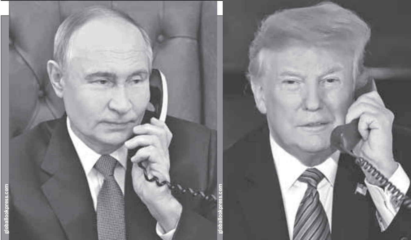
После визита в Москву Стива Уиткоффа его друг и босс, президент США Дональд Трамп, проговорил с коллегой Владимиром Путиным 2,5 часа.