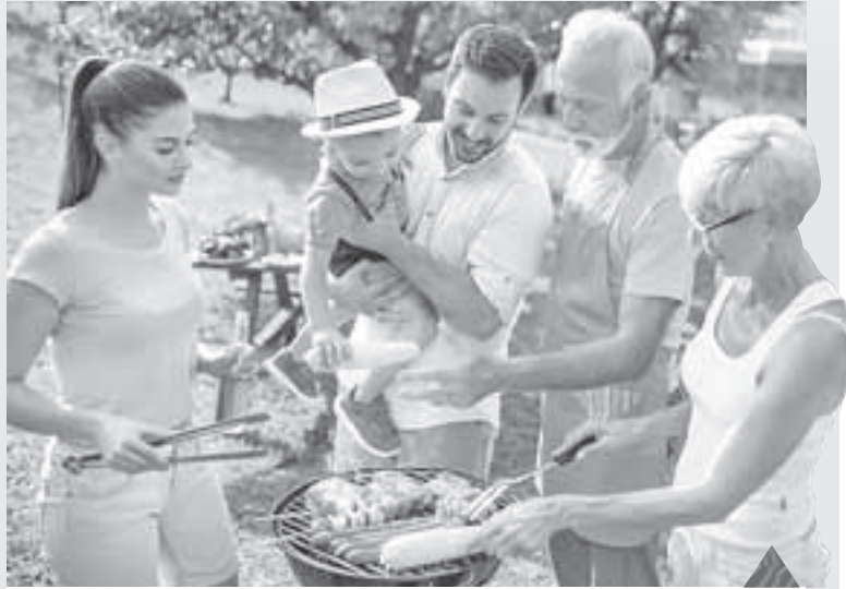
Мясо на природе всегда вкуснее, чем дома. Ученые этот феномен объяснить не могут.