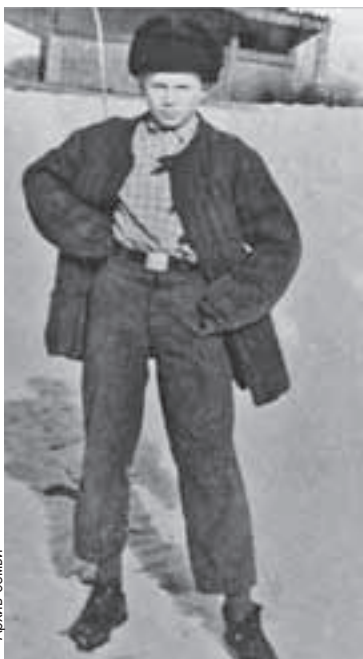
На этом фото Вове Жириновскому - 10 лет. Почему штаны такие короткие? Какие были на барахолке, такие и купили. Алма-Ата, 1957 г.

- Его мама растила шестерых детей одна. Потому папа по-особому отно-