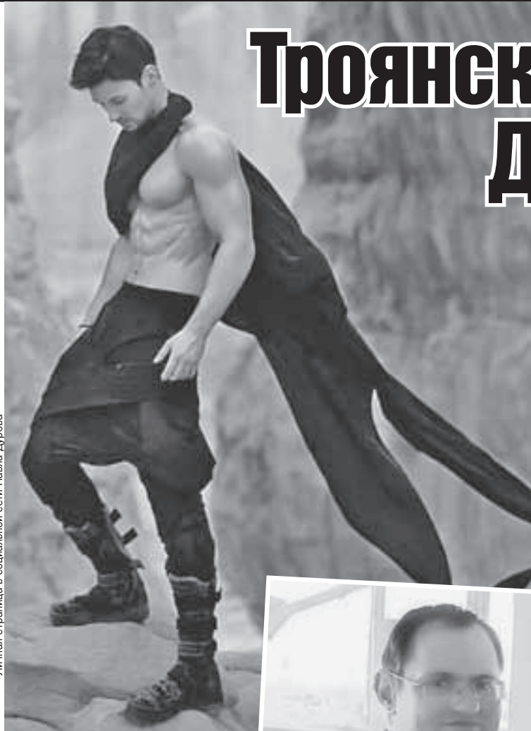
Личная страница в социальной сети Павла Дурова