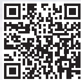
Фото присылайте в «Комсомольскую правду», e-mail: miss@kp.ru

Голосуйте за понравившуюся вам участницу на нашем сайте KPRU в разделе «Будь стильной с «КР»!