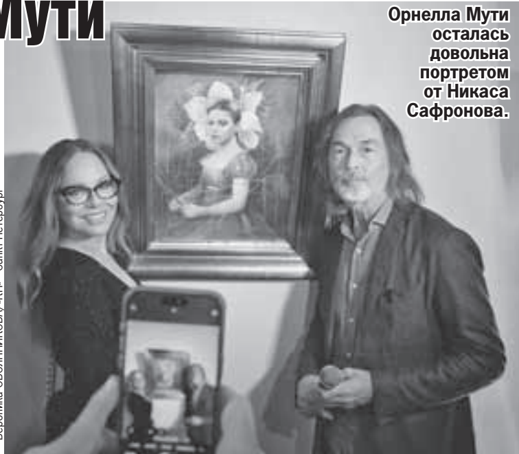
Орнелла Мути осталась довольна портретом от Никаса Сафронова.

- А это ваш портрет, здесь вы молодая и вписаны в цветок, я хочу вам его подарить, -