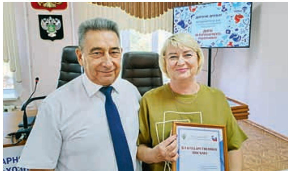
Сотрудники учреждения трудятся на совесть.

- Мы постоянно развиваемся в соответствии с современными тенденциями