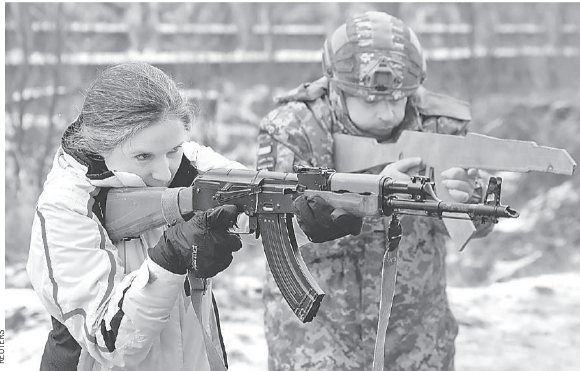
Под Киевом мужики-инструкторы с фанерными макетами учат женщин стрелять из настоящего автомата. Стремятся научиться немногие.

- Пошли отсюда, таких идиотов полный Крещатик, - топчет меня мой приятель.