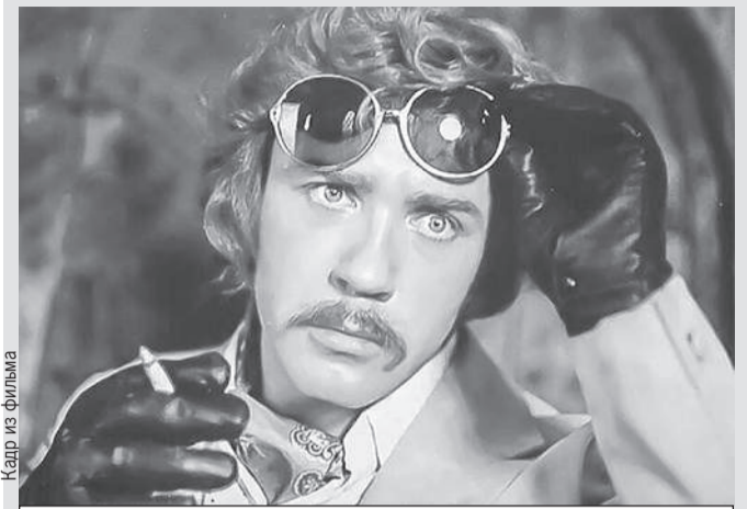
Артист сыграл более 200 ролей в кино (кадр из комедии «Иван Васильевич меняет профессию»).