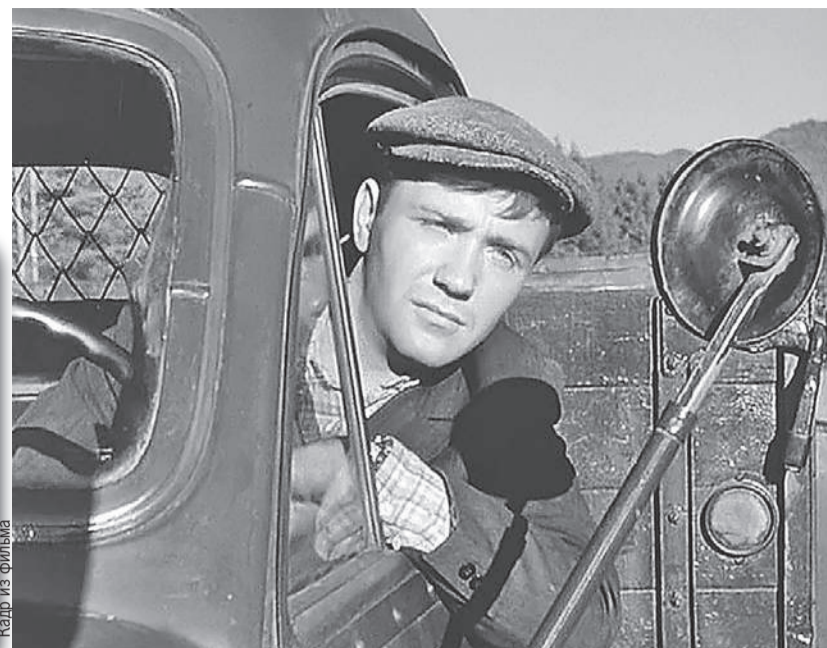
Роль шофера Пашки Колокольникова актер называл любимой и лучшей («Живет такой парень», 1964, режиссер - Василий Шукшин).