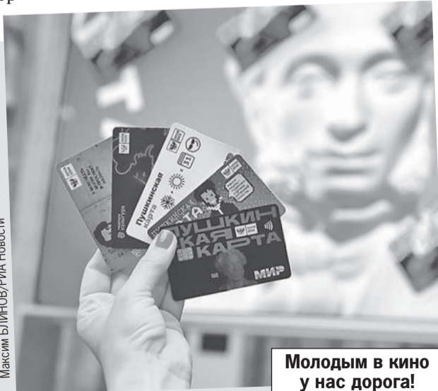
Молодым в кино у нас дорога!

С 1 февраля Пушкинской картой для молодежи можно оплачивать билеты в кино. Правда, не на любые фильмы. В списке - те, что созданы при поддержке Минкульта, Фонда кино и региональных органов власти, а также из золотой коллекции отечественного кинематографа. Что именно посмотреть за госсчет, можно выбрать в приложении «Госкультура» или на сайте культура.рф.