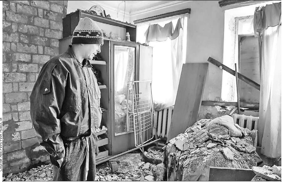
На Украине сейчас из каждого утюга вещают о грядущем «российском вторжении», а ВСУ между тем продолжают методично обстреливать города и поселки ДНР и ЛНР. Диалог с республиками Киев вести не желает. На фото: житель Донецка в своем доме на улице Дружбы, в крышу которого попал снаряд.

Сергей Лавров: - Президент отвечал на этот вопрос: если Зеленский хочет обсуждать нормализацию двусторонних отношений, страдающих от действий его режима, мы готовы - пожалуйста, пусть приезжает в Москву, в Сочи, в Петербург. Но если он хочет обсуждать Донбасс, идите, пожалуйста, в контактную группу, в которой должны напрямую рассматриваться все вопросы урегулирования между Киевом и Донецком, Киевом и Луганском. А когда он заявляет, что не будет с ними разговаривать, это плохо для внутриукраинского кризиса.