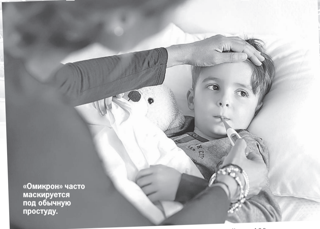
«Омикрон» часто маскируется под обычную простуду.