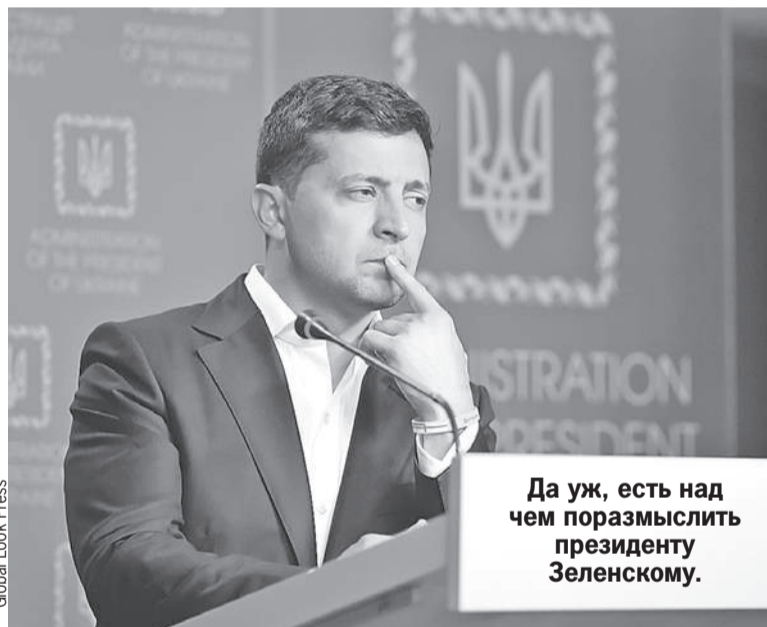
Да уж, есть над чем поразмыслить президенту Зеленскому.

На месте ЦРУ я бы так уж сильно не рассчитывал на необандеровцев. Нагадить они, конечно, могут. Но переломить ситуацию, взять власть - нет. Разумеется, если остальные граждане Украины не захотят еще раз наступить на бандеровские грабли русофобской самостоятельности. Но что такое, неуловимо разлитое в воздухе подсказывает, что второй серии у этой бандеровской истории не будет.