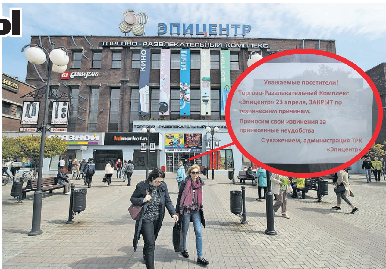
На площади перед «Эпицентром», где привычная логистика и так была нарушена из-за ремонта улицы Баранова, стало еще больше людей с ничего не понимающими лицами.

Трагедия произошла накануне днем на территории СНТ «Балтийская вишенка». По предварительной инфор-