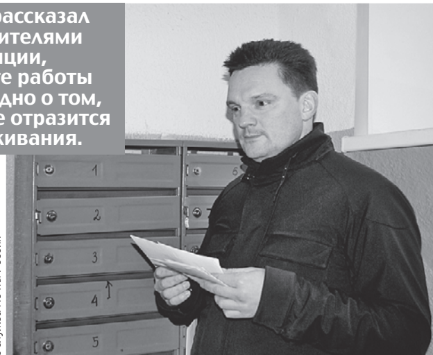
Пресс-служба Почты России

- Надо разбираться в каждом конкретном случае. Одна из наших основных задач сейчас - развивать логистику. То есть создавать для писем