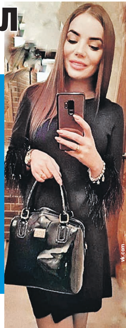
Вторая жена Карина выдержала два года домашнего ада.

- Нередко причины агрессии кроются в психических заболеваниях. Одно из них - биполярное расстройство с эффективными компонентами. Это болезнь, которая протекает от приступа к приступу. В остальное время человек внешне здоров. Во время приступа агрессору нельзя противоречить, иначе больной может начать избивать людей и крушить все на своем пути. Срочно вызывайте полицию и психиатрическую бригаду «Скорой». Сейчас есть сложности с госпитализацией таких пациентов - они должны дать свое согласие лечь в стационар. Но если человек отказывается, то медики обязаны документально засвидетельствовать, что он в неадекватном состоянии. А в «светлый» период жизни родственникам стоит настоять на визите к врачу.