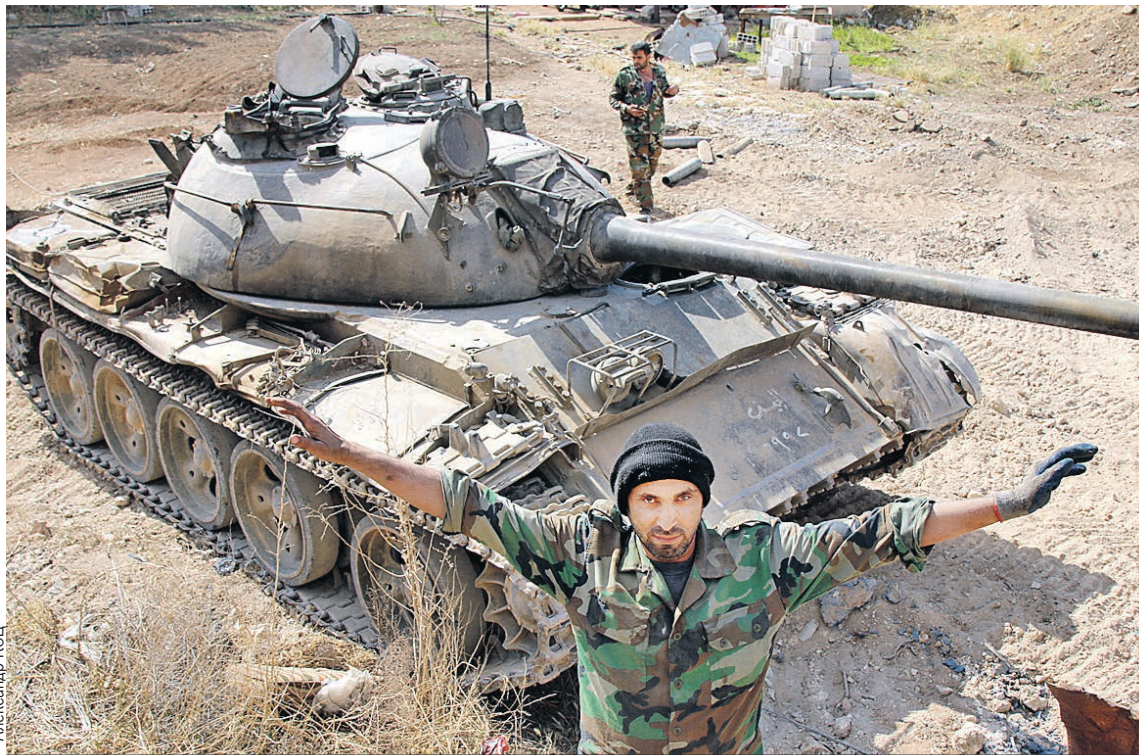
Танкисты правительственных сил ведут обстрел боевиков, метр за метром освобождая от них сирийскую землю.

До недавнего времени Ярмук между собой делили разные группировки, среди которых - и недобитки из ИГИЛ. Когда был решен вопрос с Восточной Гутой, боевики на юге столицы прекрасно понимали, что теперь примутся и за них. Большинство вняло аргументам российских переговорщиков и предпочло выехать на «зеленом экспрессе» в сторону Идлиба. Игиловцам же выезжать фактически некуда - желающих принять к себе этих отморожков нет даже среди таких террористических группировок, как «Джейш аль-Ислам» или «Фронт ан-Нусра». Поэтому упираться они будут до конца. Но на моих глазах сирий-