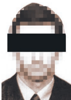
Вот он, агент-убийца Гордон. Говорите, ничего не видно? А вот британцам сразу все ясно стало.

В деле Скрипаля появился первый подозреваемый и даже фоторобот. Но такой, что лучше бы его не показывали, чтобы не позориться: с закрытыми глазами и полностью размытым лицом. Но с важной припиской: «Подозреваемый убийца Гордон в 80-х годах». Такая точность, конечно, призвана развеять любые заковыки в вас сомнения.