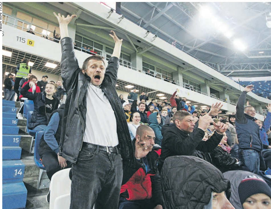
Болельщики не жалели голосовых связок, поддерживая родную команду.

Больше фотографий и видео смотрите в нашей галерее