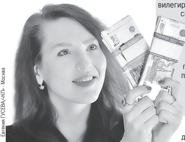
Евгения ГУСЕВА/«КП» - Москва

Аналитики советуют присмотреться к ценным бумагам банка.