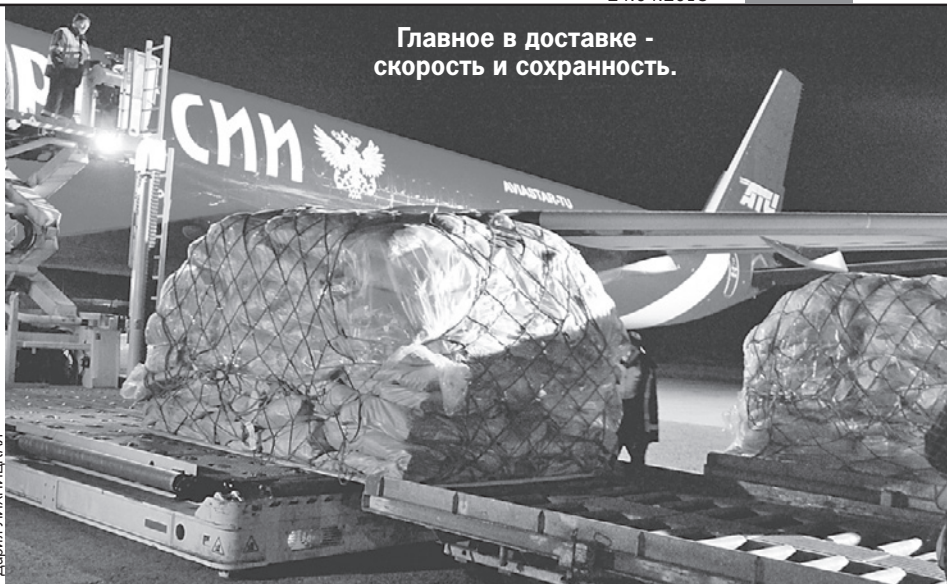
Главное в доставке - скорость и сохранность.

- Это очень важный элемент социального сервиса. В 2018 году мы решили не повышать тарифы, оставили их на уровне прошлого года. Примерно на 2,5 тысячи изданий предоставляем скидку - от 20 до 25%. Мы дружим с газетами и журналами и стараемся максимально гладко проводить подписную политику, даже неся при этом существенные затраты. За 2017 год мы из собственных средств выделили около 1,5 млрд. рублей на предоставление скидок для подписчиков и издателей.