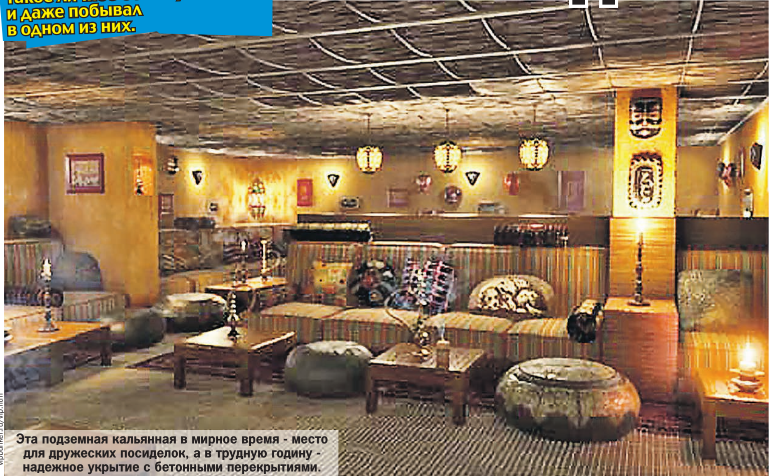
Эта подземная кальянная в мирное время - место для дружеских посиделок, а в трудную годину - надежное укрытие с бетонными перекрытиями.

Спецкор «Комсомолки» попробовал заказать такое личное бомбоубежище и даже побывал в одном из них.