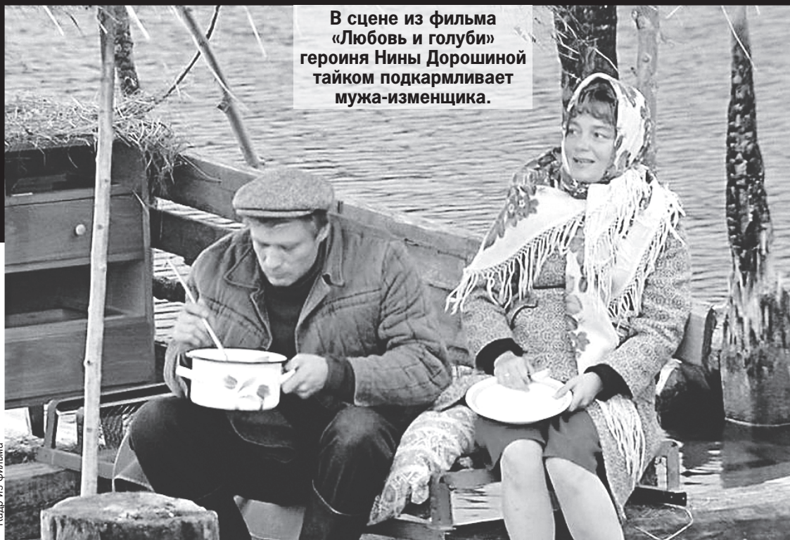
В сцене из фильма «Любовь и голуби» героиня Нины Дорошиной тайком подкармливает мужа-изменщика.

- У нее душа была добрейшая, ей хотелось всех осчастливить... Она любила театр, и там, на сцене, выражалось ее необыкновенное сердце, ее душа, ее обаяние. Ее любили люди, а завоевать любовь не так-то просто. Это уни-