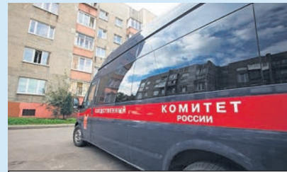
Делом занимается Следственный комитет.

- В настоящее время назначена судебно-медицинская экспертиза, изъята техническая документация, устанавливаются лица, ответственные за технику безопасности на строительном объекте. По результатам проверки будет принято процессуальное решение, - рассказала офици-