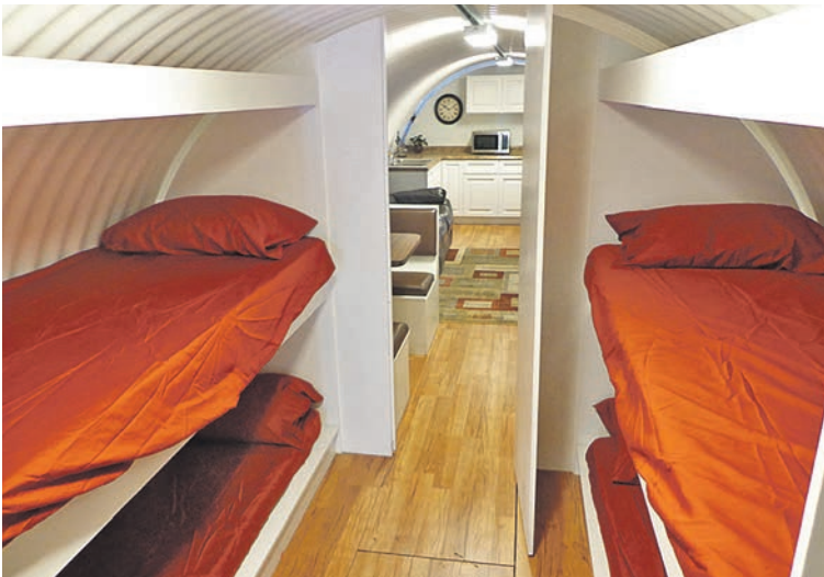
Этот вариант типа купе - бюджетный, сделанный в металлической трубе диаметром метра 3 - 4, вкопанной в землю на глубине метра-двух, с минимумом удобств.

атаки: ударную волну, облучение, радиоактивную пыль. А в мирное время мы поможем оформить его под кинозал, винный погреб, кальянную, тренажерный зал или сейф.