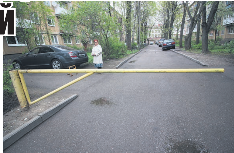
Чтобы установить шлагбаум во дворе, необходимо, чтобы за это решение проголосовало большинство жильцов.

Учитывая, что пожарные сейчас запросто могут закрыть любой торговый центр, имейте в виду, что ваш шлагбаум им тоже не понравится, так как пожарная машина или другая спецтехника должна иметь свободный доступ к любому подъезду. Для решения этой проблемы потребуется установка будки с вахтером (экономным соседям дополнительный сбор за эту услугу вряд ли понравится). Более дешевым выходом может стать видеонаблюдение,