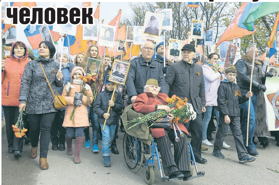
Колонна пройдет традиционно через площадь Победы по Гвардейскому проспекту к мемориалу 1200 воинам-гвардейцам.

Координаторы шествия в Калининграде сообщили, что во избежание неприятностей участники колонны «Бессмертного полка» будут проходить обязательный персональный досмотр. Воду в пластмассовой таре принести можно, а от стеклянной и металлической тары (в том числе термосов) просят воздержаться. Также недопустимо наличие колющих и режущих предметов.