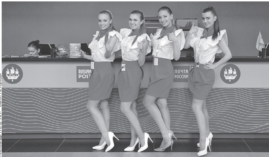
В ближайшее время восприятие ведомства населением кардинально изменится.