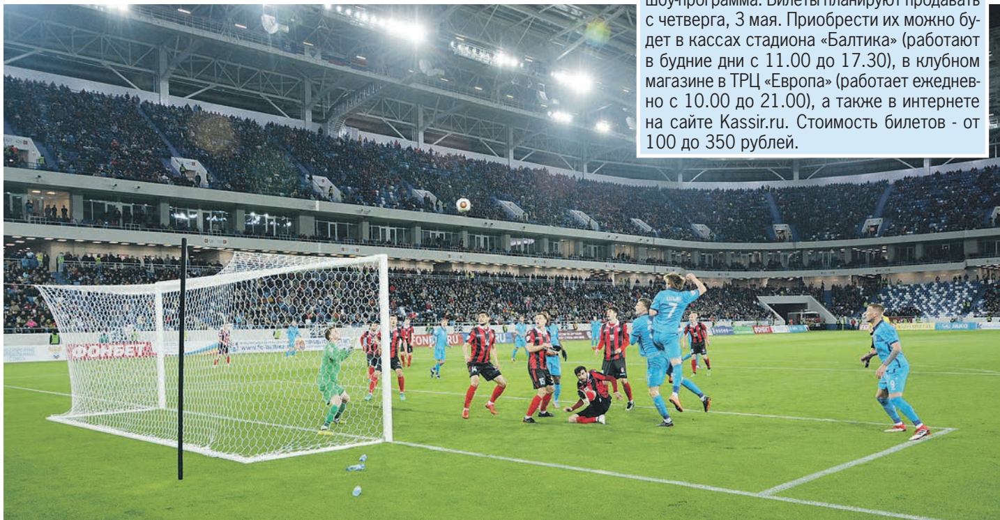
К сожалению, голов калининградская публика так и не дождалась - 0:0.

Подмосковная команда «Химки», с которой сражалась «Балтика» на поле, в первом тайме выглядела слабо и вынужденно отбивала атаки калининградцев. Как ни кричали болельщики,