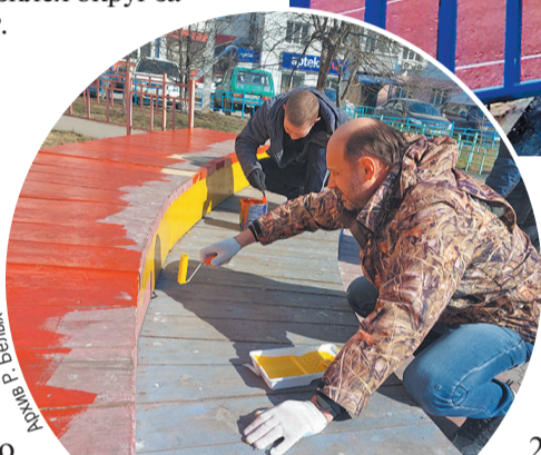
Ростислав Белых лично участвует в благоустройстве округа, субботниках и акциях.

Школа № 75 в микрорайоне Энергетиков. Здание было построено в 1963 году по типовому проекту и тогда, вполне отвечало потребностям в учебных местах. Но время идет, население растёт, и школа давно не справляется с потоком учеников. Несколько лет назад по нацпроек-