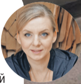
Фото присылайте в «Комсомольскую правду», e-mail: miss@kp.ru

- Сочетание таких базовых цветов, как черный и белый, кажется, навсегда останется актуальным. Его сила в контрастности и универсальности.