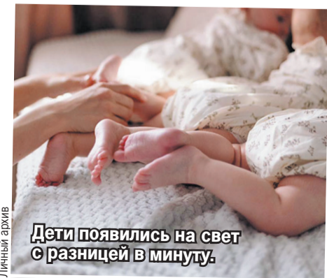
Дети появились на свет с разницей в минуту.

Первые полтора месяца после выписки прошли спокойно. Девочки в основном ели и спали. Но постепенно время сна сокращалось, а капризов становилось больше.