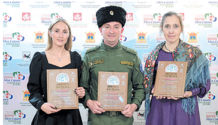
Конкурс «Лучший центр казачьей культуры Иркутской области» и его победители - «Благовест», «Исток» и «Ладья».

«Любовь и воля, и казачья доля» - под таким названием в июне прошёл фестиваль казачьей культуры в архитектурно-этнографическом музее «Ангарская деревня» в Братске. Праздник собрал представителей казачьих округов - Прибайкальского, Ангарского и Ангаро-Ленского, который стал и главным организатором масштабного события. Место проведения было выбрано неслучайно: Братский острог основал казачий атаман, русский землепроходец Максим Перфильев.