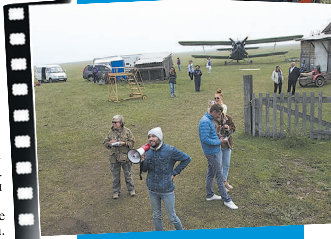
Дмитрий Певцов сыграл летчика и зрителя заброшенного аэродрома на берегу Байкала.

лен тем, что здесь активно развивается два направления кино - авторское и продюсерское, - говорит Настя. - Первое направлено прежде всего на самовыражение автора, второе больше коммерческое, но в хорошем смысле