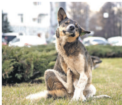
Ник олай ОБЕРЕМЧЕНКО «КП» - Пермь

РАДИО КОМСОМОЛЬСКАЯ ПРАВДА FM.KP.RU Иркутск 91,5 FM | Братск 99,5 FM