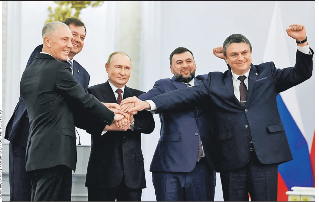
Владимир Путин и главы четырех новых российских регионов (слева направо): Владимир Сальдо (Херсонская область), Евгений Балицкий (Запорожская область), Денис Пушилин (Донецкая Республика) и Леонид Пасечник (Луганская Республика) - после подписания договоров о включении их в состав России.

✓ Запад растоптал принцип нерушимости границ. Он сейчас решает, кто имеет право на самоопределение, а кто этого недостоин. Гегемония имеет характер деспотизма и апартеида: делят мир на вассалов и на тех,