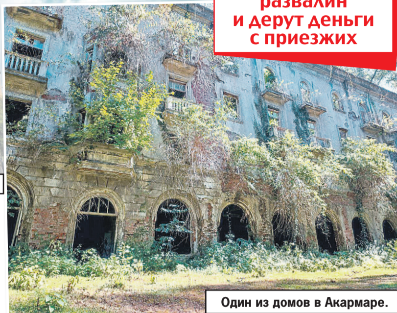
Один из домов в Акармаре.

Вадим АЛЕКСЕЕВ, Виктория МИНАЕВА («КП» - Новосибирск)