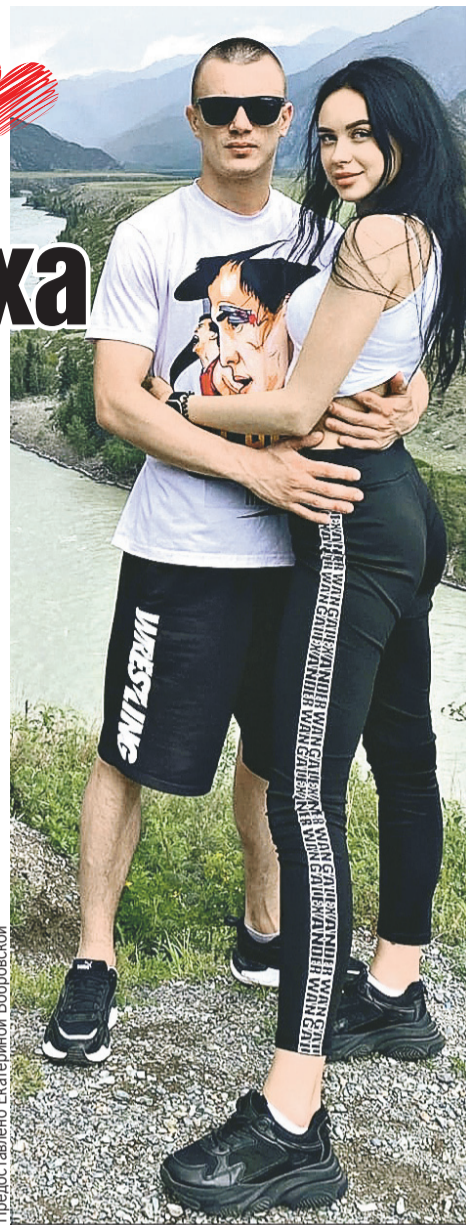
Годовщину отношений ребята отметили на Алтае.