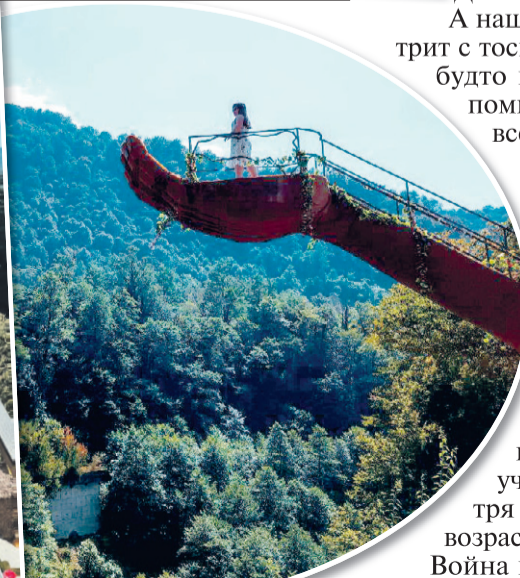
За вход на руку придется заплатить 150 рублей.