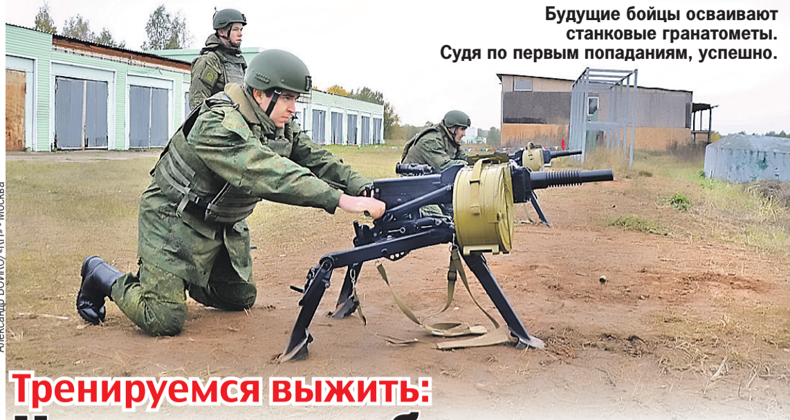
Будущие бойцы осваивают станковые гранатометы. Судя по первым попаданиям, успешно.