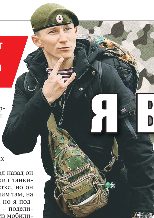
Настрой - боевой!