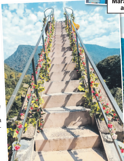
Лестница на руку, по бокам - искусственные цветы.