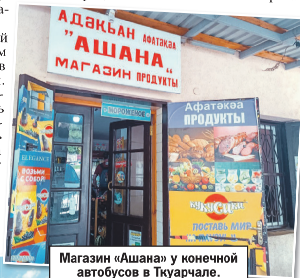
Магазин «Ашана» у конечной автобусов в Ткуарчале.