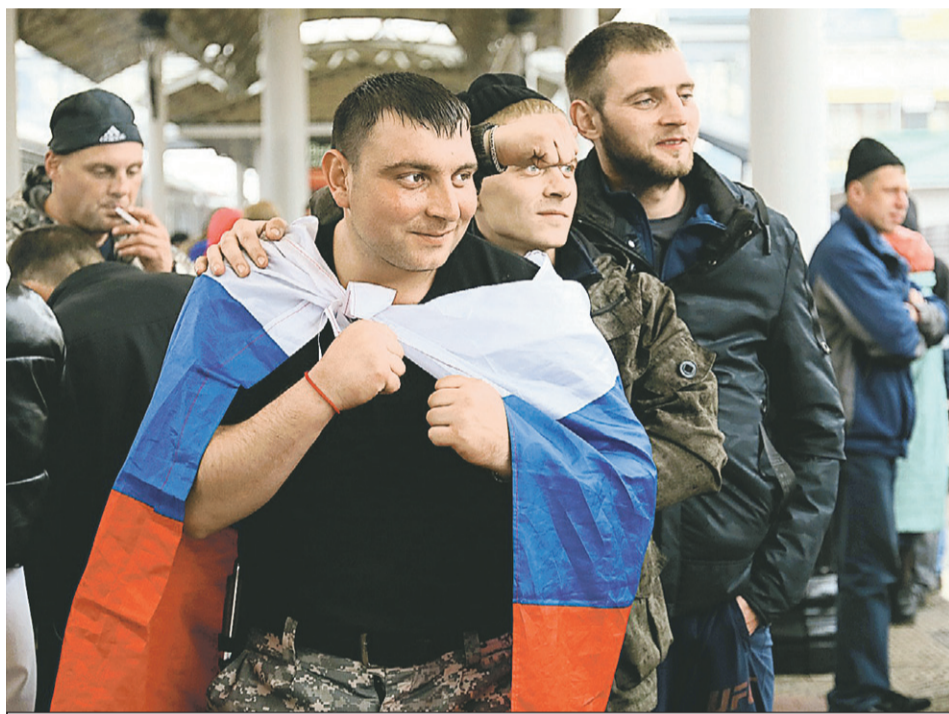
Кто-то взял с собой не только рюкзак с вещами, но и флаг.