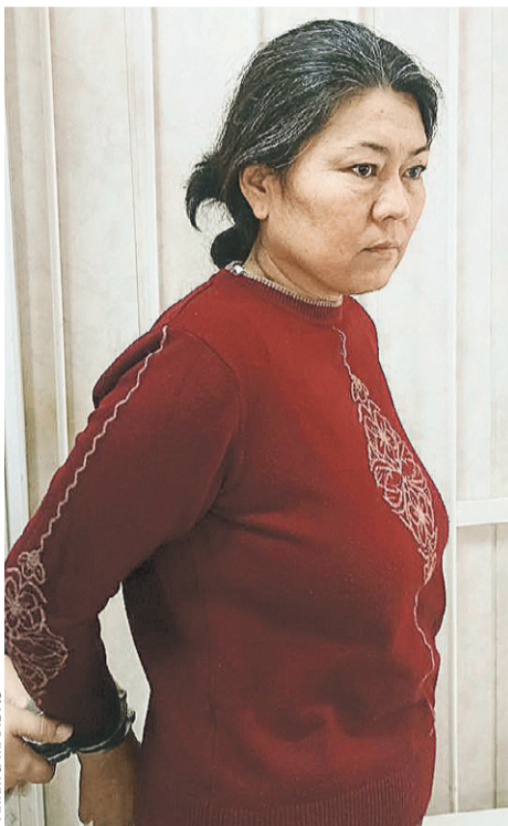
44-летняя Айнагул уже почти год находится в СИЗО.

в ресторан. Да так хорошо посидел, что дома решил продолжить выпивать. И только через сутки протрезвел и спохватился: сумку-то забыл на парковке.