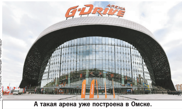
А такая арена уже построена в Омске.

Строительство ледовой арены началось летом 2019 года, в августе 2022 года здание должно было быть сдано. Но то коронавирус, то санкции - и сроки стали сдвигать. Заместитель Председателя Правительства РФ Дмитрий Чернышенко во время своего визита остался недоволен темпами работ, а также тем, что изменили смету. Разбор полетов состоялся в августе. Тогда отставание от графика составляло 78 дней - и новый ЛДС пла-