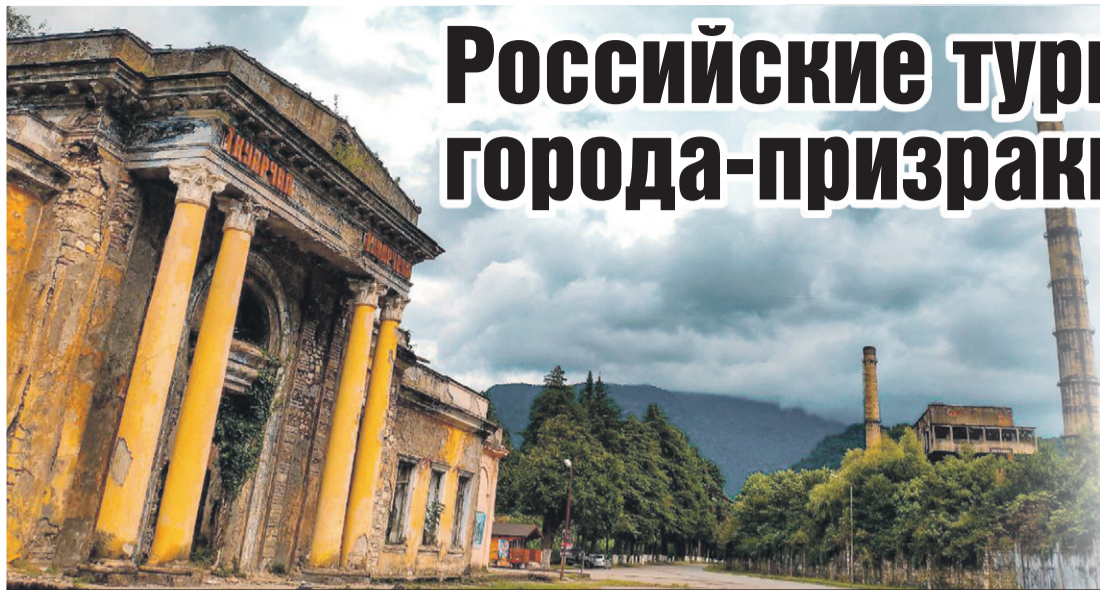
Заброшенный железнодорожный вокзал в Ткуарчале.

Местные там живут среди развалин и дерут деньги с приезжих