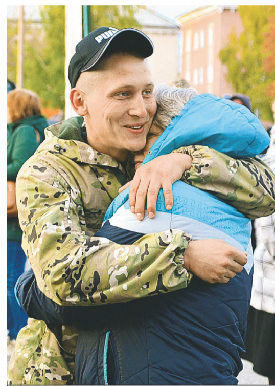
Женщины провожают любимых.

А в Братске проводили 313 человек в Новосибирск. Они отправи-