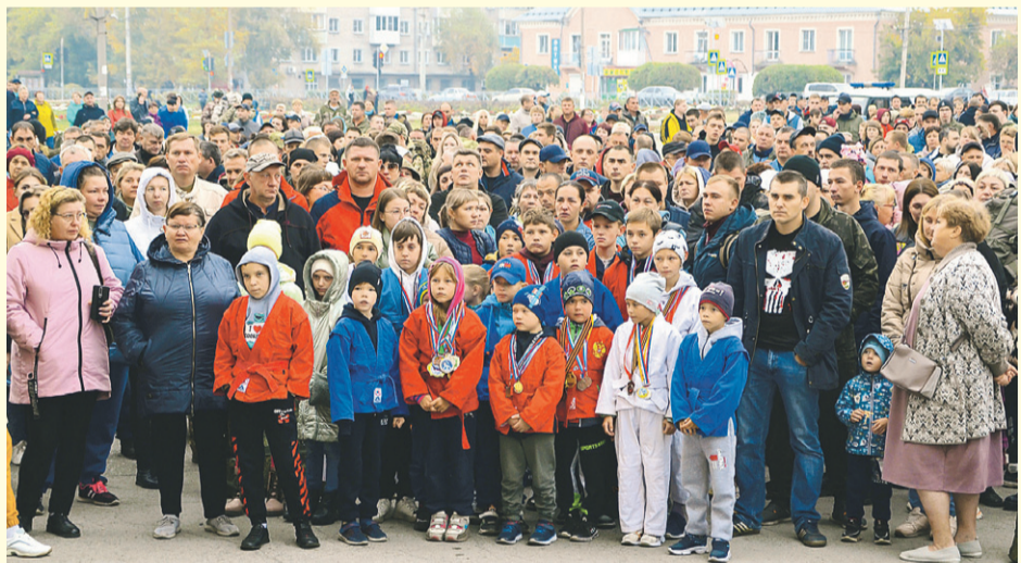
Городок Барабинск в Новосибирской области. Малыши-спортсмены провожают своего тренера. А за ними стоят многочисленные местные жители.