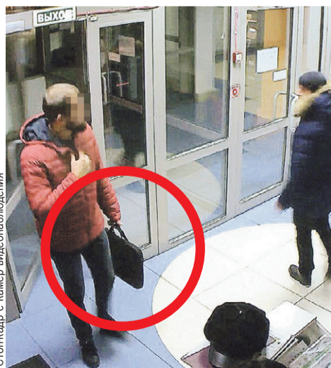
Камера засняла, как бизнесмен с сумкой в руках идет в ресторан.

А пока хранил состояние, спрятав под кроватью, нежно закутав в наволочки. В тот вечер, уверяет несостоявшийся волк с Уолл-стрит, положил миллионы в сумку. Думал через банкомат закинуть деньги на брокерский счет, но сперва махнул