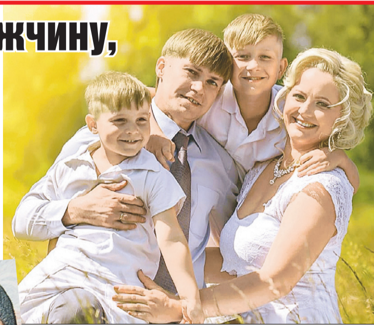
Супруги женаты 17 лет и воспитывают двух сыновей.

- Нам его установил папа, чтобы в 21.00 мы были дома. И я помню, как всегда бежали сломя голову и залетали