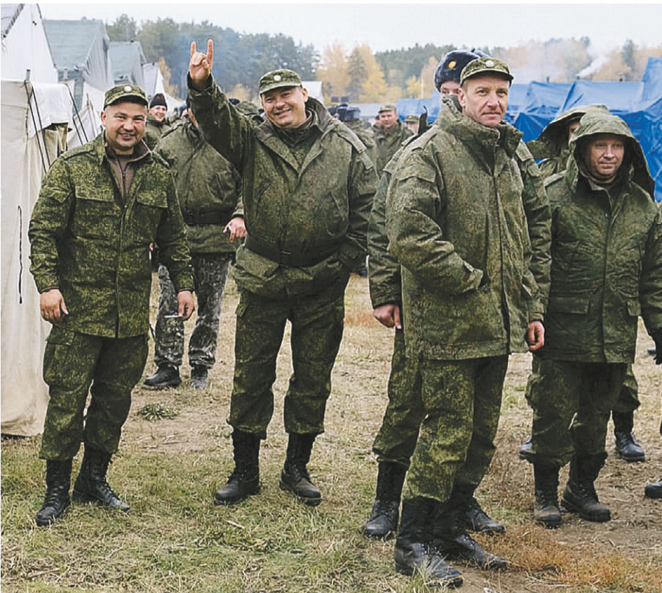
Новосибирск принимает резервистов из четырех сибирских регионов. Там развернут в том числе палаточный городок, где командиры и рядовой состав привыкают к полевым условиям.

ить. Объяснился: решение добровольное, выполняет свой долг.