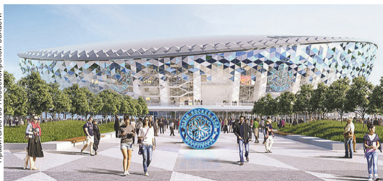
Такой будет ледовая арена в Новосибирске.