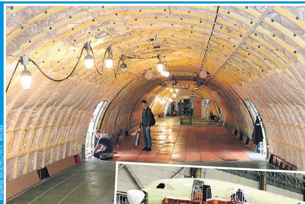
Владимир МАЗЕНКО/«КП» - Москва

- Если пассажирский Ил-96 будет значительно дешевле аналогов, то даже тот факт, что он менее экономичен из-за высокого расхода топлива, сделает его коммерчески выгодным для авиакомпаний, - говорит Гусаров.