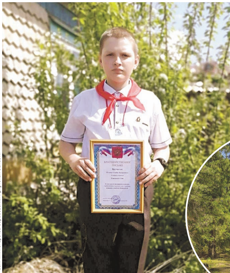
Сёму наградили за смелость и отвагу.

и несколько взрослых из ближайших домов. К приезду пожарных пламя сдержали, не дали перекинуться на дома. Отстояли! Но даже после прибытия профессионалов мальчик не ушел домой, а помогал им тушить огонь.