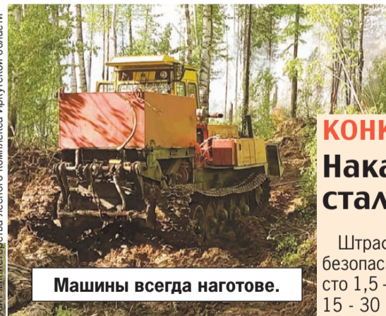
Машины всегда наготове.

✓ О нарушениях требований пожарной безопасности в тайге можно сообщить по телефону доверия ГУ МЧС по региону: 8 (3952) 409-999.