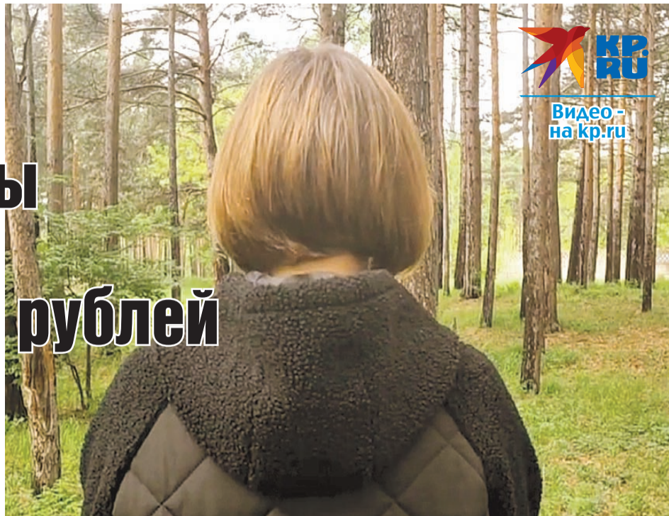
Женщину оговорили, якобы срок действия пользования номером телефона истекает и его следует продлить, продиктовав код из СМС.