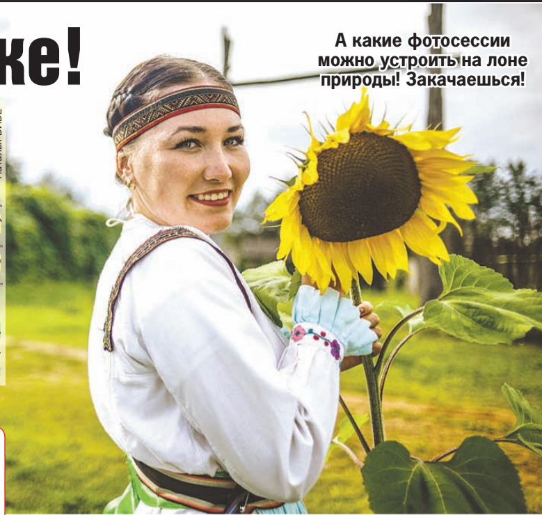
Виктор ГУСЕЙНОВ/«КП» - Москва

Вот, кстати, и цифры. За последние 10 лет, с 2012 года, Иркутск вырос всего на 20 тысяч жителей, до 617 тысяч, а пригород прибавил сразу треть населения, увеличившись со скромных 90 до 141 тысячи. Например, во всем Маркова раньше проживало