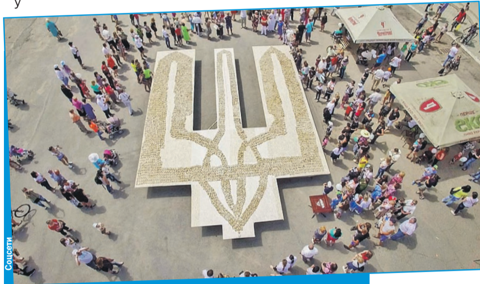
Нацбилдинг (построение нации по-украински) - выкладывание самого большого трезубца из бутербродов с салом.

На самом деле в Мариуполе все не так страшно, как на картинках. Повреждены внешние дома в кварталах, которые оборонялись. Заходишь за закопченный дом,