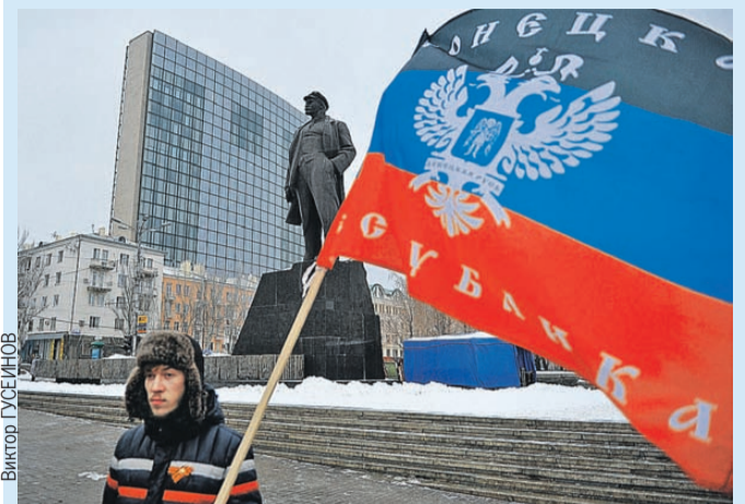
Донецк просит о прекращении войны. Но Киев донбасцев будто бы отказывается слышать.

В Париже завершился саммит глав четырех государств (подробности на стр. 2).