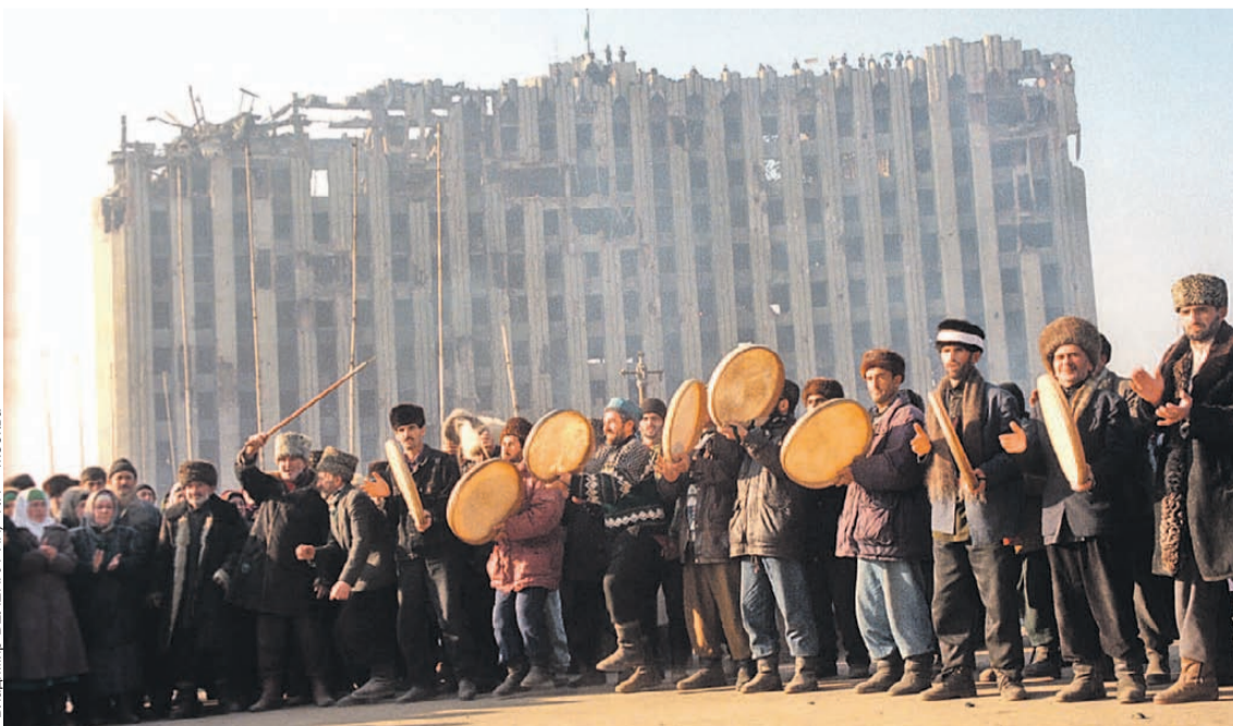
Чеченцы празднуют победу после провала штурма Грозного. Позади - все, что осталось от Дома правительства республики.