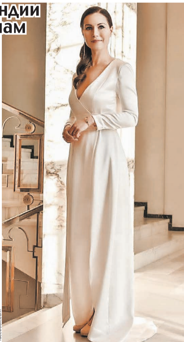
Санна Марин стала известным политиком, когда возглавила достаточно крупный финский город Тампере. Правила она там, как признаются местные жители, железной рукой.