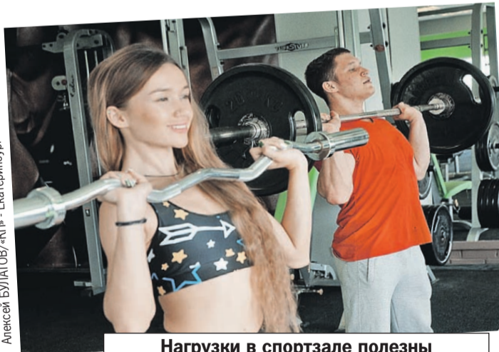
Нагрузки в спортзале полезны для сердца. Если их одобрил врач.

Но ориентироваться лучше не на класс препарата, а на конкретное назначение, которое сделает ваш лечащий врач.