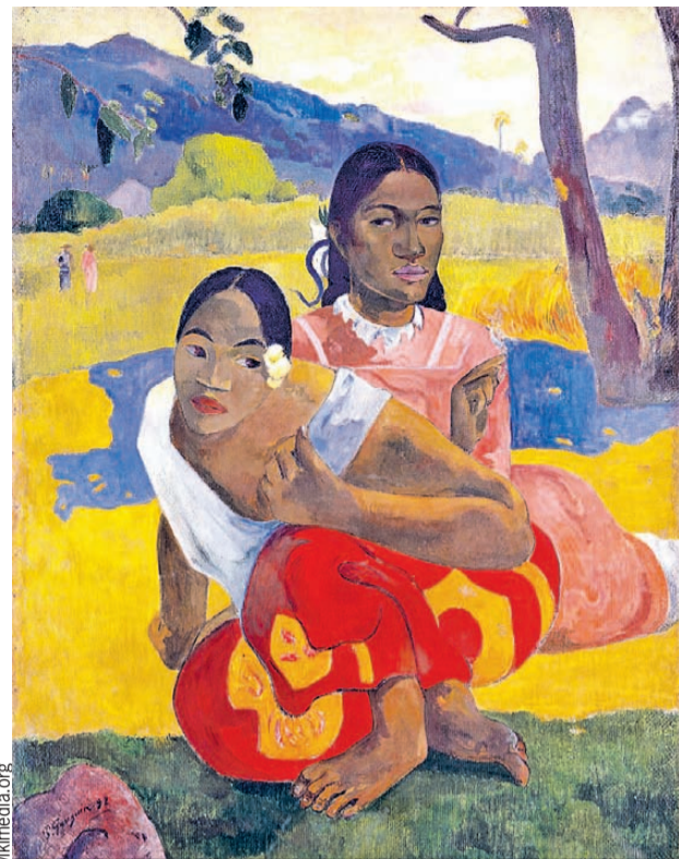
Картина «Когда свадьба?» недавно была продана Катару за рекордные 300 миллионов долларов. Туда феминизм еще не добрался.