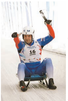
Федерация санного спорта России