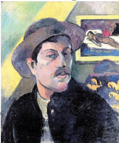
На заднем плане автопортрета Гоген изобразил обнаженной свою юную туземную жену. В XXI веке некоторые сочли это безобразием.