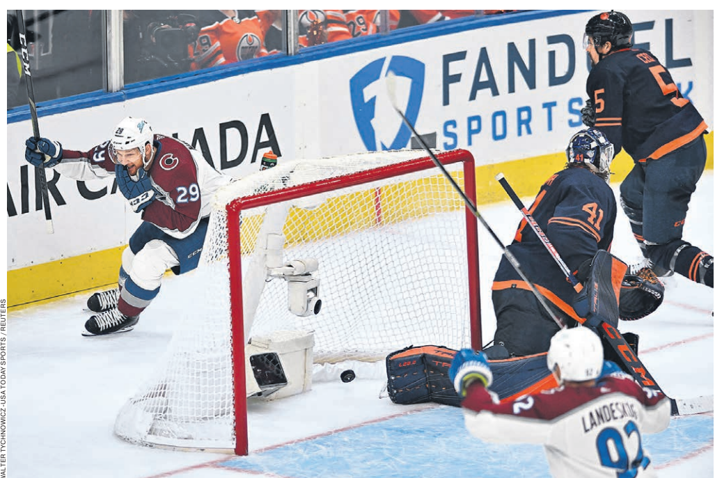
Шайба форварда «Колорадо» Нейтана Маккиннона (№29) в ворота «Эдмонта» в четвертом матче полуфинальной серии стала для него 11-й в нынешнем play-off

«Колорадо» подтвердил котировки в регулярном чемпионате, финишировав на верхней строчке в таблице Западной конференции, а потом