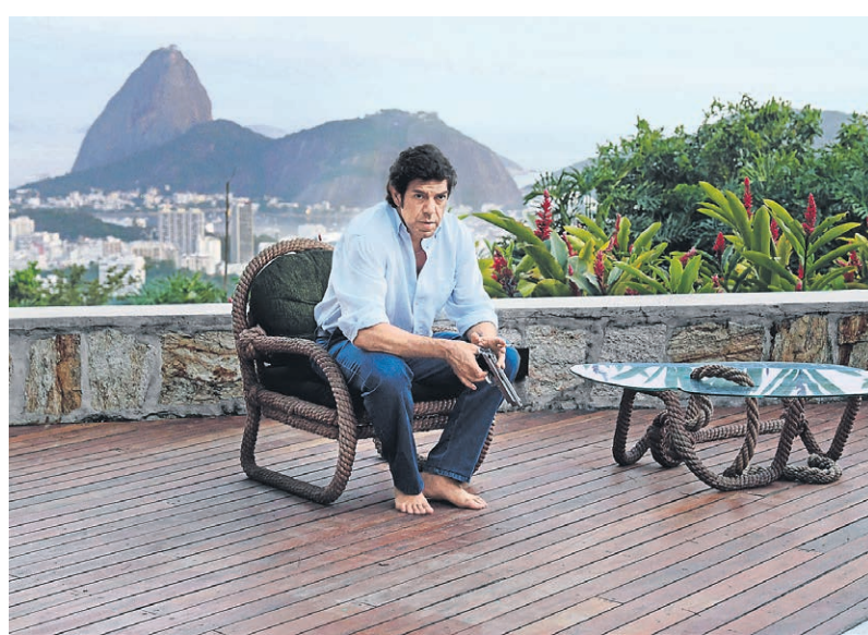
Безмятежные виды Сицилии составляют резкий контраст душевной смуте Томмазо Бушетты (Пьерфранческо Фавино)

С ентябрь 1980 года. На вилле в Палермо собираются несколько больших семей, чтобы вместе отметить праздник святой Розалии. А задно договориться о переделе рынка героина: все присутствующие — члены мафиозных кланов Палермо и Корлеоне, рвущие друг у друга самую выгодную статью преступного экспорта-импорта. Камера выхватывает из толпы лица, задерживаясь на каждом не больше секунды: яркий свет в лицо, имя, фамилия — как на снимке для уголовного дела. Запомнить из них стоит одного, Томмазо Бушетту (Пьерфранческо Фавино), также известного как дон Мазино. Формально он не продвинулся дальше статуса простого «солдата», так как слишком любил женщин и развлечения, чтобы всего себя отдавать «нашему делу» (cosa nostra), но не зря его называли «босс двух миров»: Бушетта провоцировал дела на трех континентах, входил в ближайшее окружение палермитанского капо и был посвящен во все секреты организации. Вот он вытаскивает с пляжа обколовшего сына, потребителя того самого продукта, которым прибыльно торгует отец и его друзья, вот подозрительно поглядывает на корлеонских, не доверяя их фальшивым улыбка. Но праздник идет своим чередом — танцы, объятия, совместное фото на память; щелчки фотоаппарата — как звуки выстрелов.