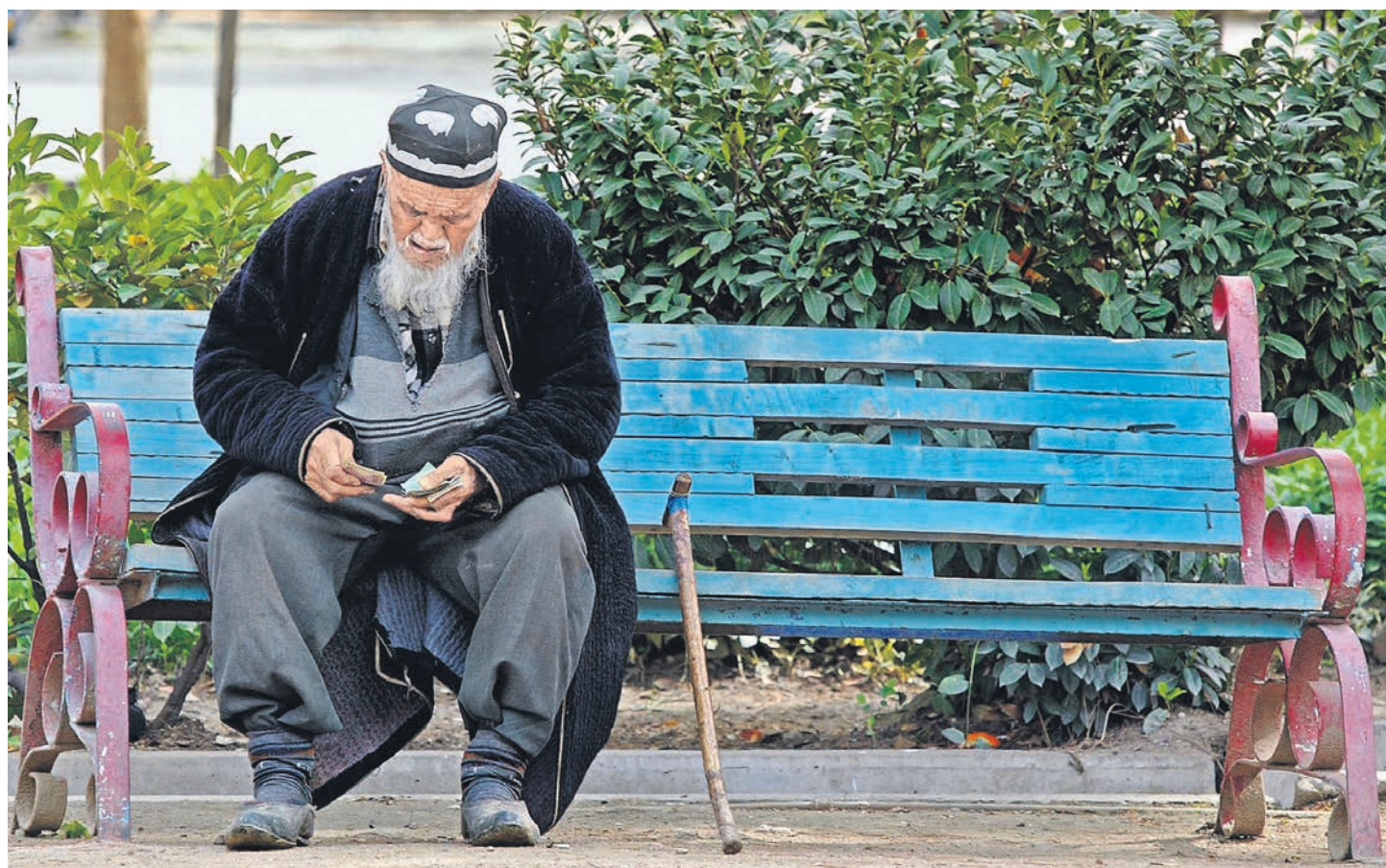
Новые правила Нацбанка Таджикистана могут оставить жителей страны без почти $2,5 млрд из России

Для прояснения «технических и регуляторных нюансов» участники встречи просили НБТ перенести срок подключения к системе на полгода, но добиться этого так и не смогли. Более того, 26 ноября НБТ разослал операторам платежных систем письмо, в котором указал, что согласно «Порядку трансграничного перевода денежных средств... в республике Таджикистан (№992 от 15.11.2019) обязывает операторов платежных систем, не подписавших соответствующее соглашение и не завершивших интеграцию с национальным процессинговым центром при НБТ, с 3 декабря приостановить де-