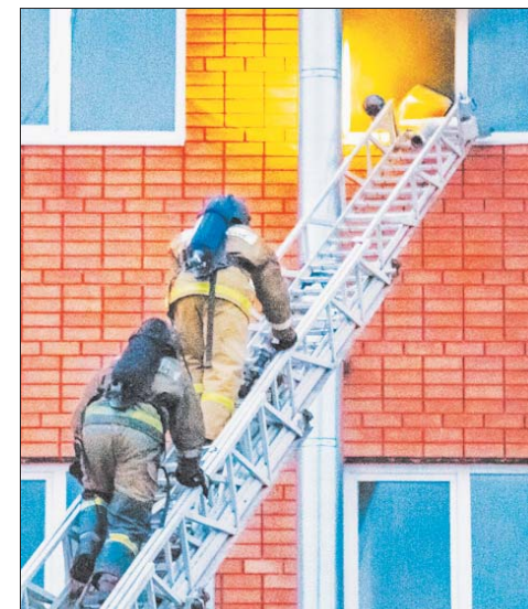
На место пожара подавалось две автолестницы.