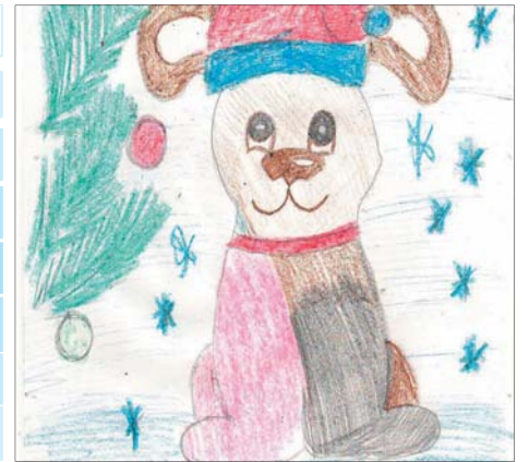
Рисунок Киришко Валерии, 6 лет, дет. сад 80.

Прогноз погоды в № 4 «КВУ» будет представлять рисунок Аврора Кирилла, 5 лет, д.сад 22.