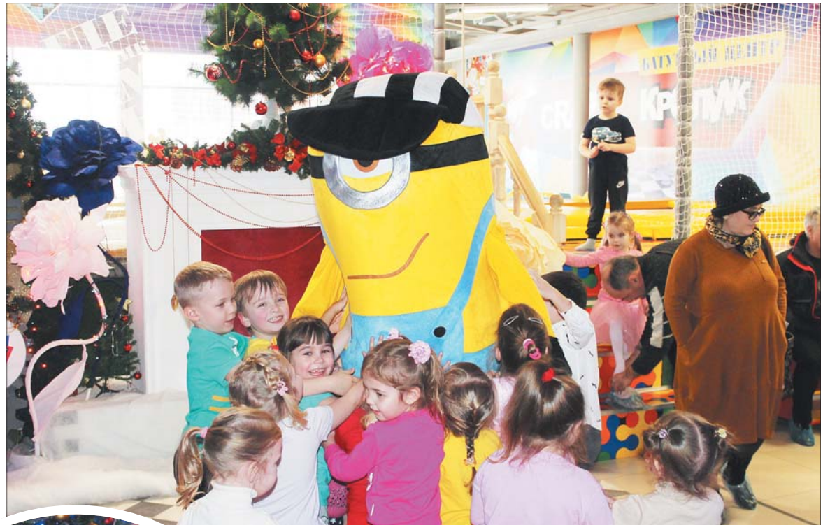
Мультяшный герой Миньон развлекал ребятню.