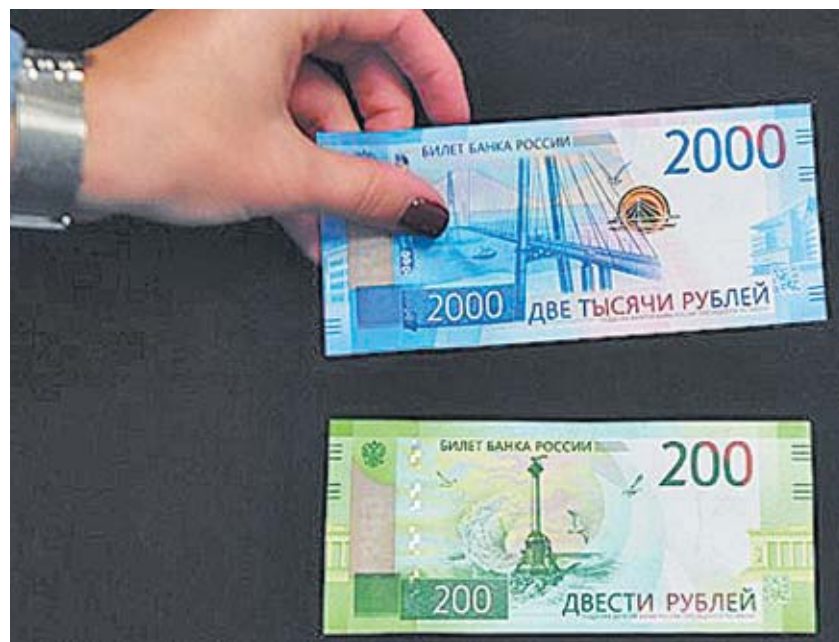
Новые банкноты пока не так часто встретишь в Шахтах.

Напомним, новые банкноты номиналом 200 и 2000 рублей были введены в обращение 12 октября, массовое обращение новых денег произошло в декабре 2017 года. Первыми новые купюры получили регионы, которые на них изоб-