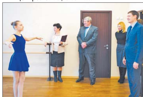
В центре будут работать разные кружки — танцевальные, художественные, спортивные и многие другие.

рисунком, хореография, студии керамики и декоративно-прикладного искусства. В планах — создание детского театра. Также будет действовать фотостудия с преподавателем. Много чего хотим сделать, планов — миллион. После нового года появится наш сайт, странички в социальных сетях, где будет аккумулироваться необходимая информация. Будем стремиться максимально работать на бесплатной основе. Понимаем, что контингент, который