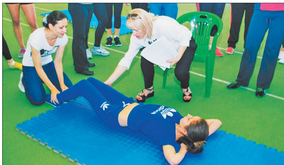
Комплекс ГТО сегодня могут сдать шахтинцы от 6 до 70 лет.

О своих результатах можно будет узнавать в онлайн режиме благодаря имеющемуся личному ID-номеру на сайте комплекса ГТО.