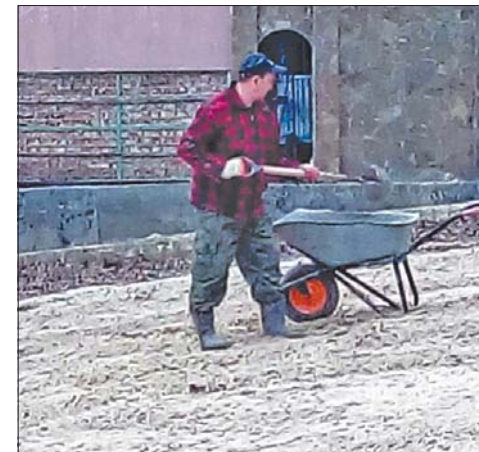
С городского пляжа посёлка 20 лет РККА вывозят песок для строительства.

Что думаете по этому поводу Вы, наши читатели? Оставляйте свои отзывы и конструктивные комментарии на сайте KVVU.SU в разделе «Общество».