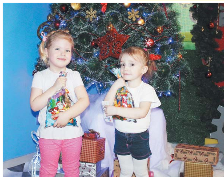
Никто из малышей не ушёл с праздника без сладкого подарка.