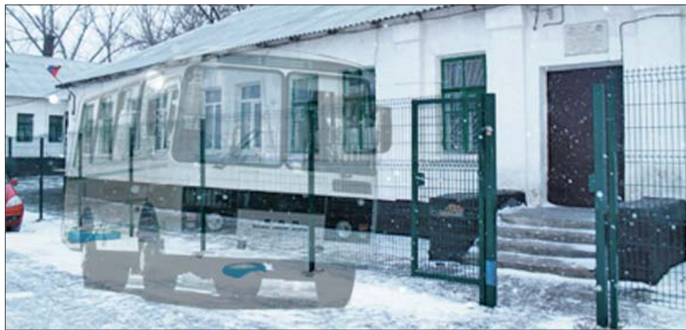
Не все жители поселка 20 лет РККА дождалась ПАЗик с медиками. Коллаж Светланы Мокроусовой.

Горожане пожаловались, что не смогли дождаться в своем поселке обещанного администрацией приезда мобильной медицинской бригады.