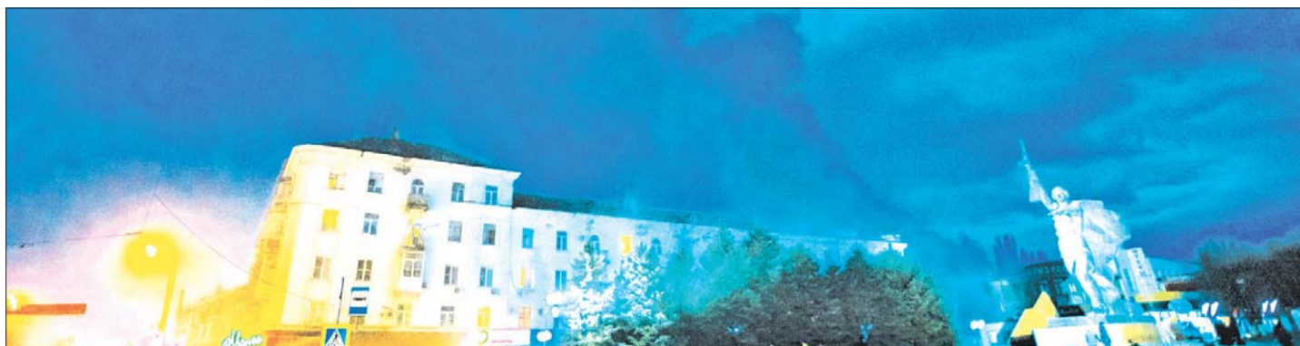
Город после обеда до позднего вечера был охвачен дымом из-за пожара на хлебопекарне.