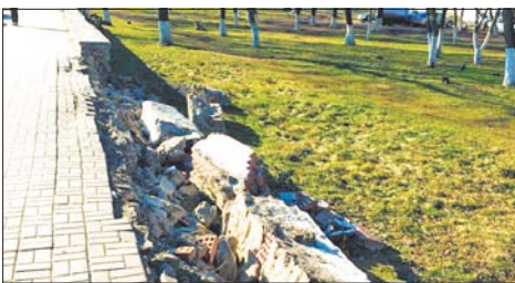
Напротив здания городской хирургии бордюры вырваны «с корнем».

— Такое впечатление, что их кто-то специально вырвал с корнем, — пишут нам читатели.