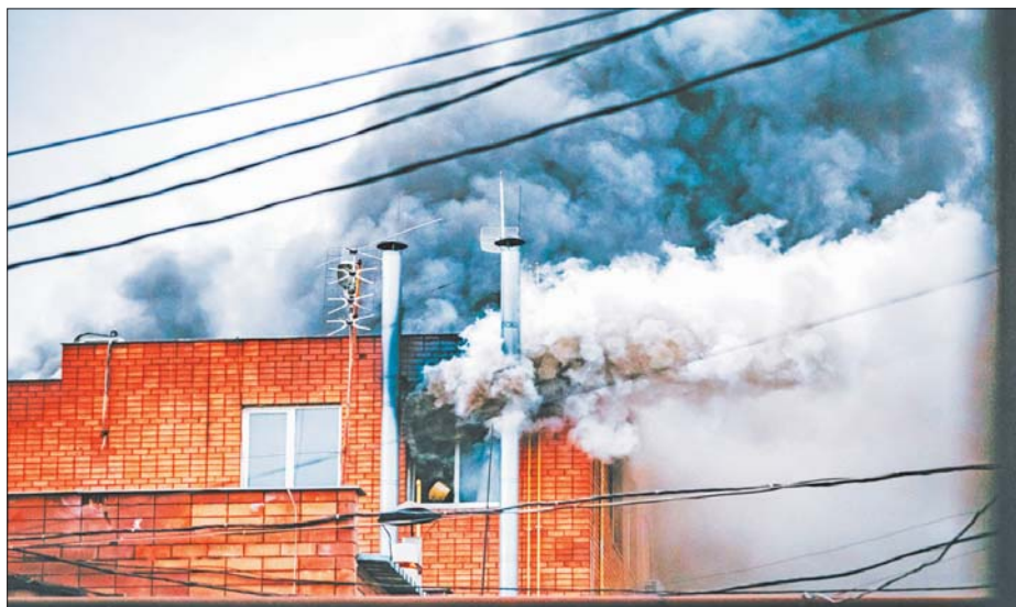
Пожарные дежурили до наступления темноты на хлебопекарне «Кундрат», чтобы не допустить распространения огня.

По воздуховодам (трубам), которые проходят по всему периметру здания и выходят на крышу, огонь распространился дальше.