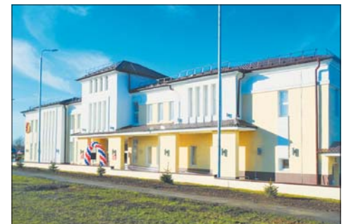
В п. Персиановский появился Центр культурного развития.

рисунком, хореография, студии керамики и декоративно-прикладного искусства. В планах — создание детского театра. Также будет действовать фотостудия с преподавателем. Много чего хотим сделать, планов — миллион. После нового года появится наш сайт, странички в социальных сетях, где будет аккумулироваться необходимая информация. Будем стремиться максимально работать на бесплатной основе. Понимаем, что контингент, который