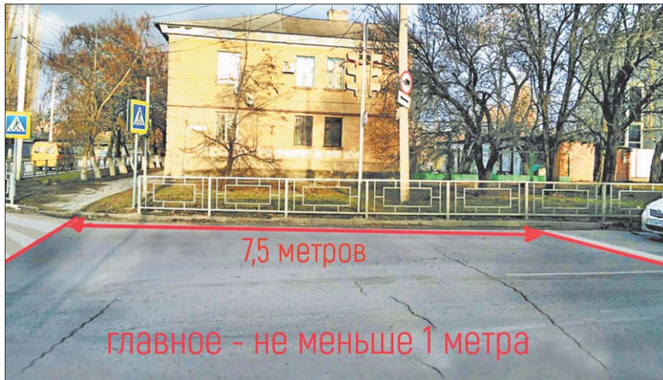
Расстояние от пешеходного перехода до стоп-линии должно быть не менее 1 метра.

Если такое же нарушение было совершено на перекрестке, который не регулируется светофором, но имеет установленный знак «Движение без остановки запрещено» — 500 руб.