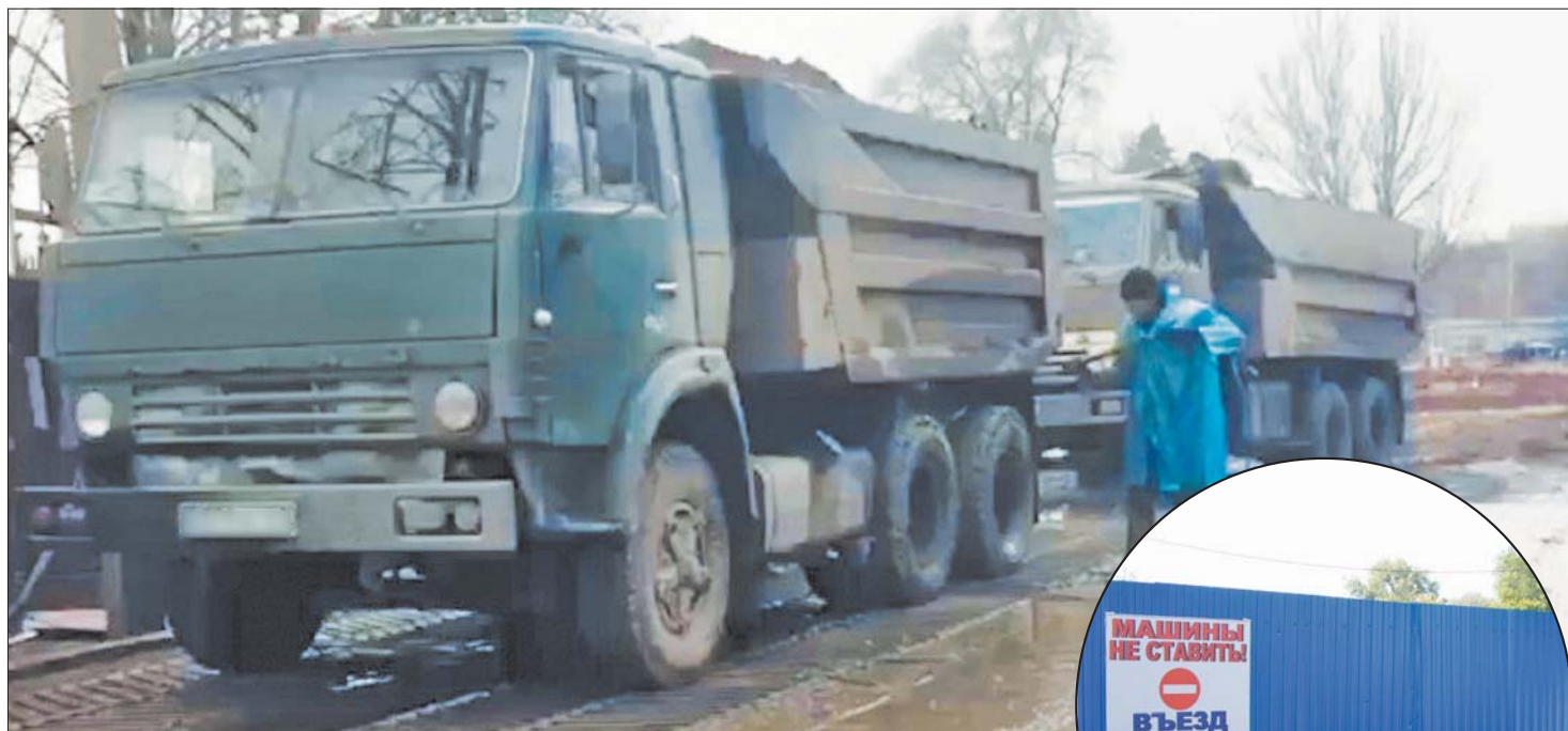
На въезде со стройплощадки большегрузам моют колёса.

— Меры, принятые застройщиком, недостаточны для исключения загрязнения улиц. Так, после промывки колёс автотранспорта на въезде со стройплощадки, автомобиль проезжает по участку дороги, не оборудованному твёрдым покрытием. Это и приводит к загрязнениям. На замечания представитель застройщика, отказавшийся представиться, реагирует агрессивно.