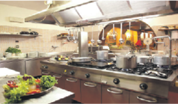
График работы 5/2. 3/п 35000 р. МОЙЩИК посуды 3/п 30000 р.

Оформление по ТК РФ, спецодежда, б/п обеды, соцпакет. Работа в ВАО. 8 (926) 810-0115, e-mail: k19@vito1.ru