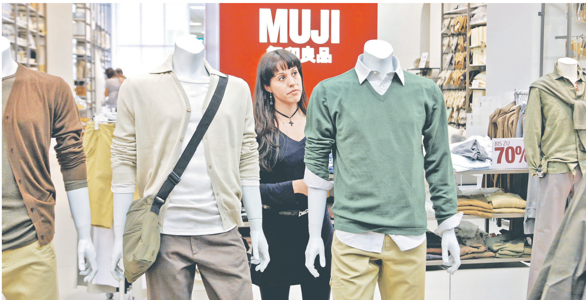
Выручка компании Muji выросла с ¥188,35 млн (111,24 млрд руб.) в 2012 году до ¥409,7 млрд (242 млрд руб.) в 2018 году