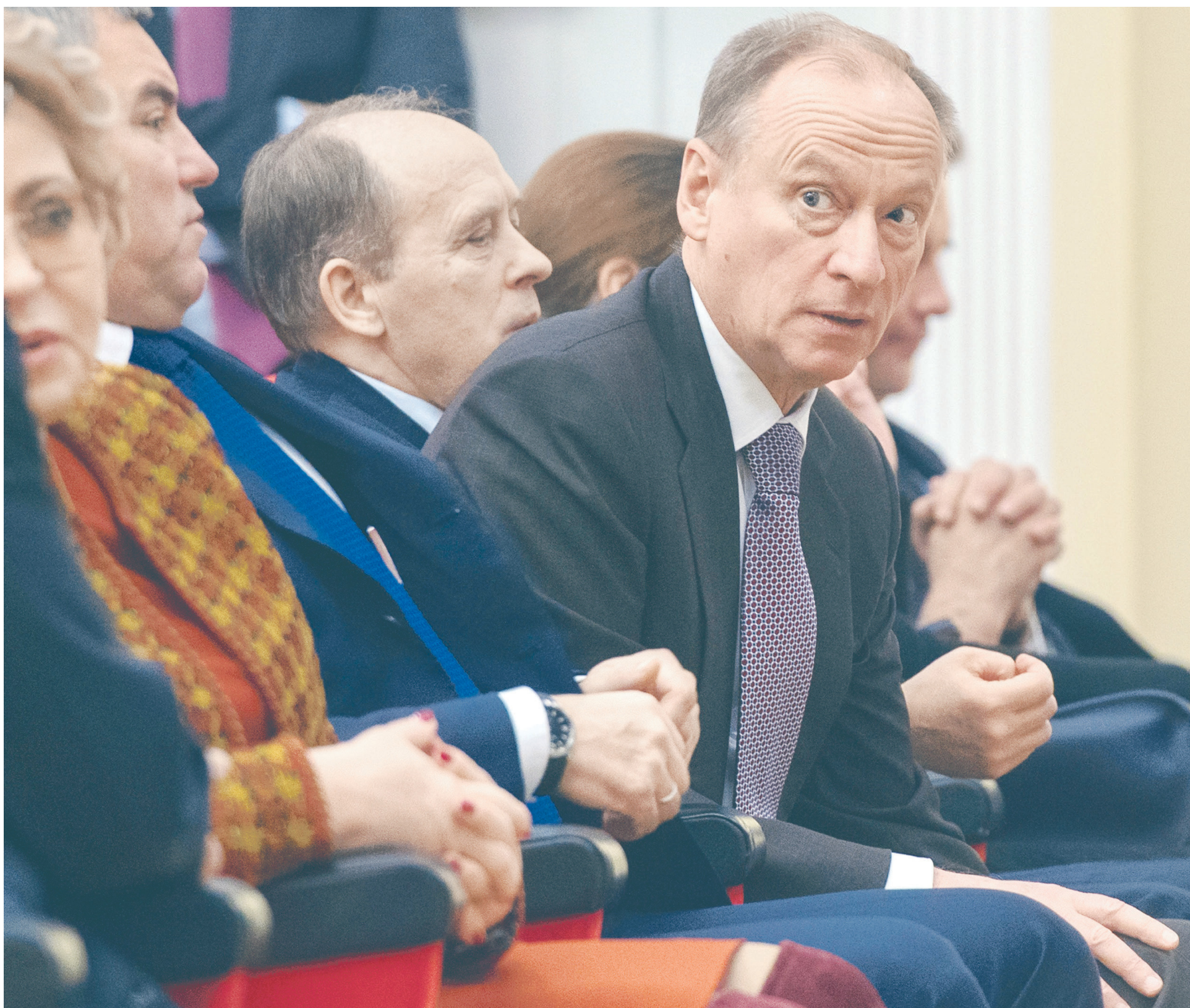
По информации источников РБК, Совбез считает передачу частот, которые используют силовики, гражданским средствам связи нецелесообразной по соображениям безопасности и обороны страны. На фото: секретарь Совбеза Николай Патрушев и постоянные члены совета Александр Бортников, Вячеслав Володин и Валентина Матвиенко (справа налево)