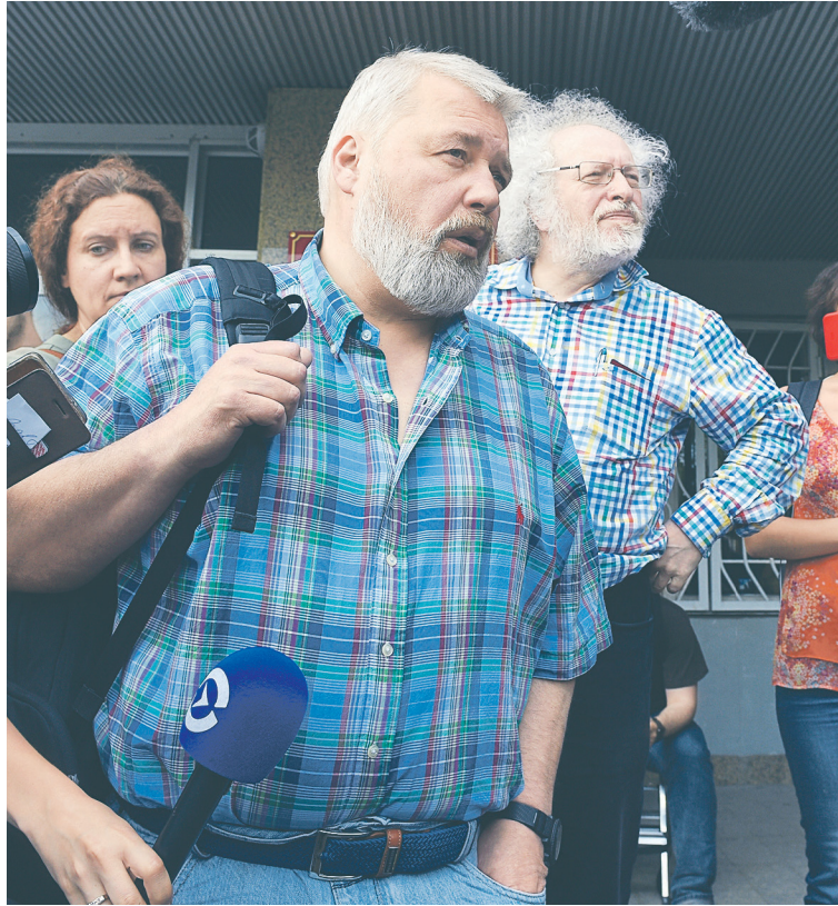
↑ Главный редактор радиостанции «Эхо Москвы» Алексей Венедиктов (справа) и один из основателей «Новой газеты» Дмитрий Муратов приехали к зданию Никулинского районного суда, чтобы выступить с совместным поручительством за Ивана Голунова