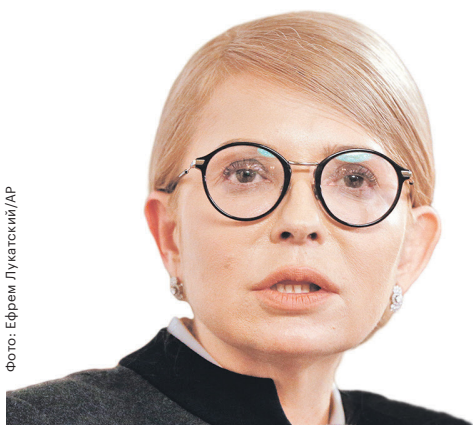
ЮЛИЯ ТИМОШЕНКО, лидер партии «Батькивщина»

Наша миссия — вступление в Евросоюз и НАТО. Только полноправное членство в Европейском союзе и Североатлантическом альянсе окончательно и бесповоротно гарантирует нашу украинскую государственную независимость, нашу украинскую национальную безопасность.