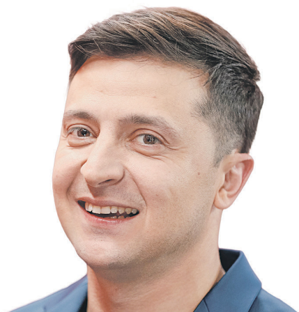
ВЛАДИМИР ЗЕЛЕНСКИЙ, актер