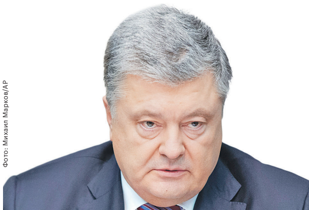
ПЕТР ПОРОШЕНКО, действующий президент Украины

Движение Украины в сторону НАТО и других объединений — залог нашей безопасности, в которое я верю и которое должно получить подтверждение через всеукраинский референдум.