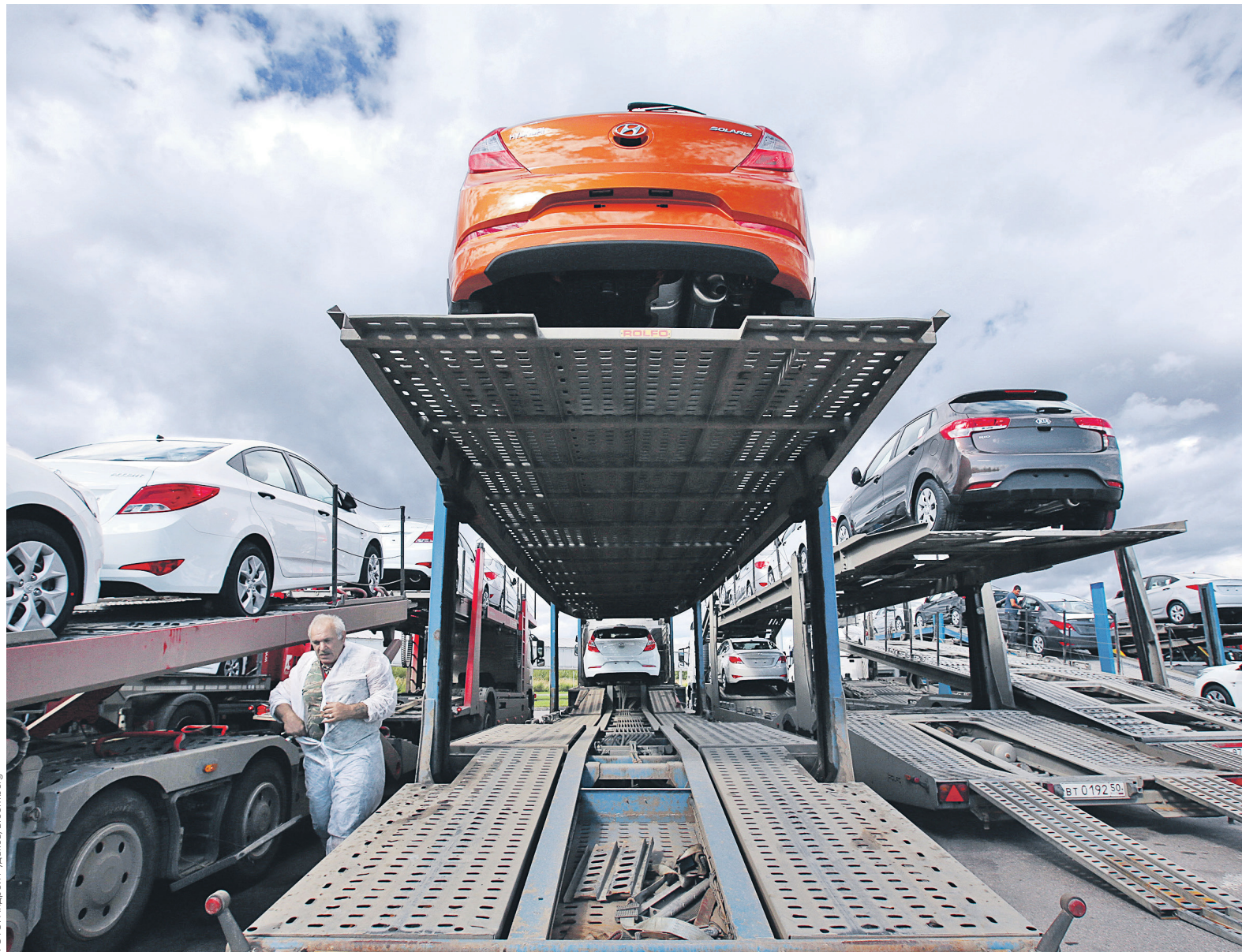
Производители и дилеры рассчитывают, что в 2018 году автомобильный рынок поднимется на новую высоту

В KPMG придерживаются более сдержанного прогноза — рост на 3–5%, до 1,65–1,7 млн машин. Партнер практики «Промышленность» консалтинговой компании «НЭО Центр» Александр Ракша отмечает, что рынок активно набирает обороты и по итогам 2018 года рост может составить до 17%.