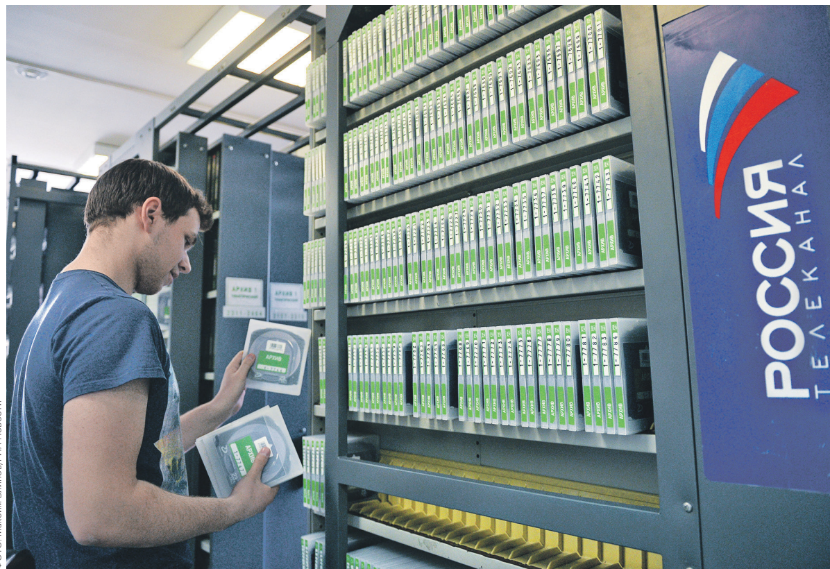
Зритель «России-1» помолодел на семь лет — с января 2018 года канал ориентируется на аудиторию 18+