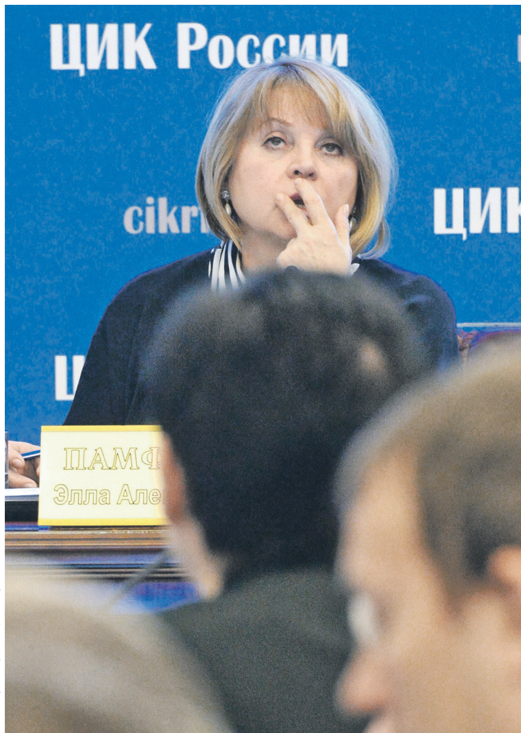
Глава ЦИК Элла Памфилова отметила, что среди желающих побороться за пост президента России появились люди «с чудинкой»

Кандидатский ажиотаж связан с выдвижением телеведущих Ксении Собчак и Екатерины Гордон, сделавших это «ради лич-