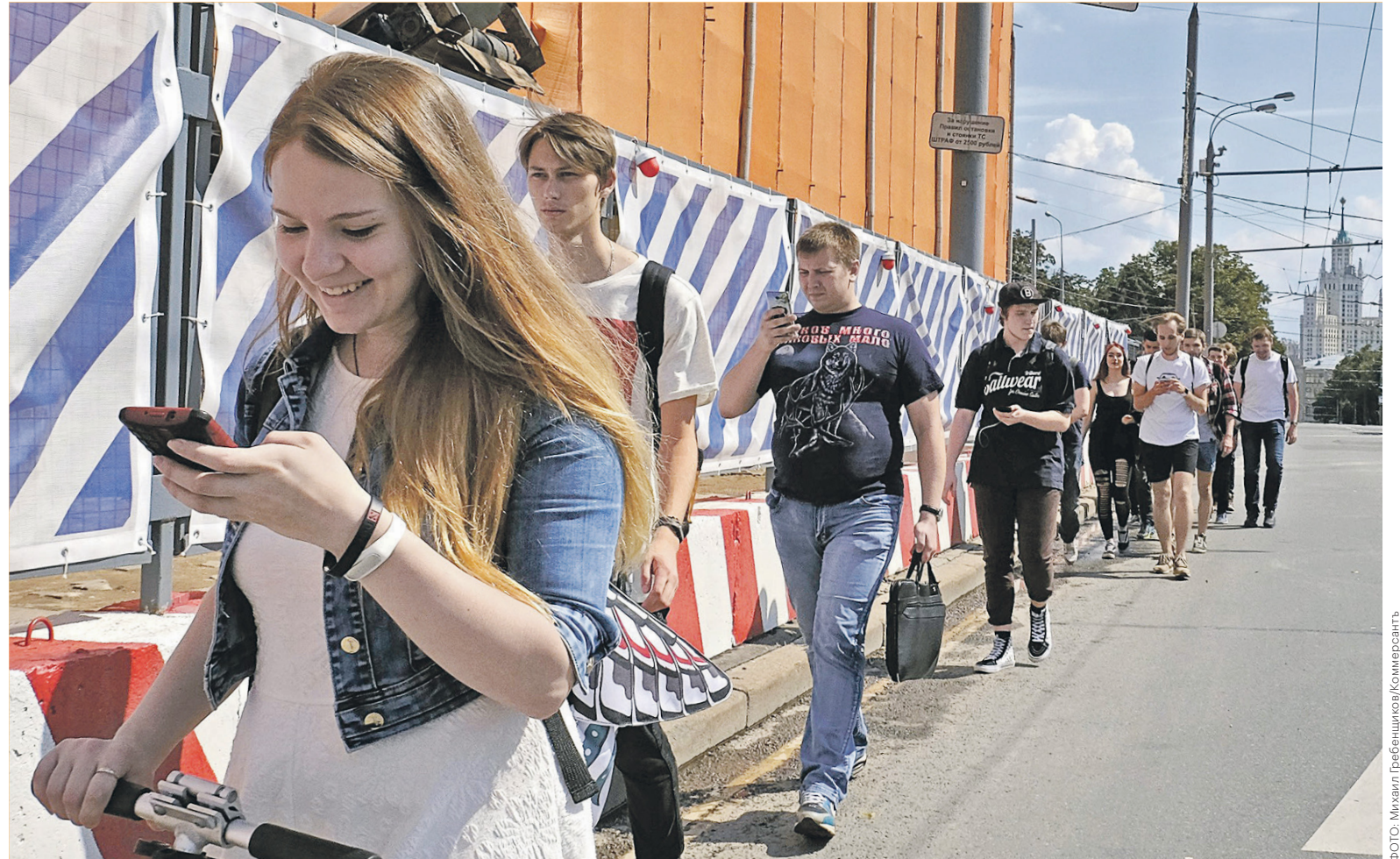
За 2016 год общий объем СМС-рассылок в России вырос на 7%, до 25,3 млрд сообщений

Комиссия пришла к выводу, что изменение сотовыми компаниями тарифной политики в части СМС-рассылки необходимо квалифицировать как нарушение ч. 1 ст. 10 закона «О защите конкуренции», которая запрещает действия или бездействие ком-