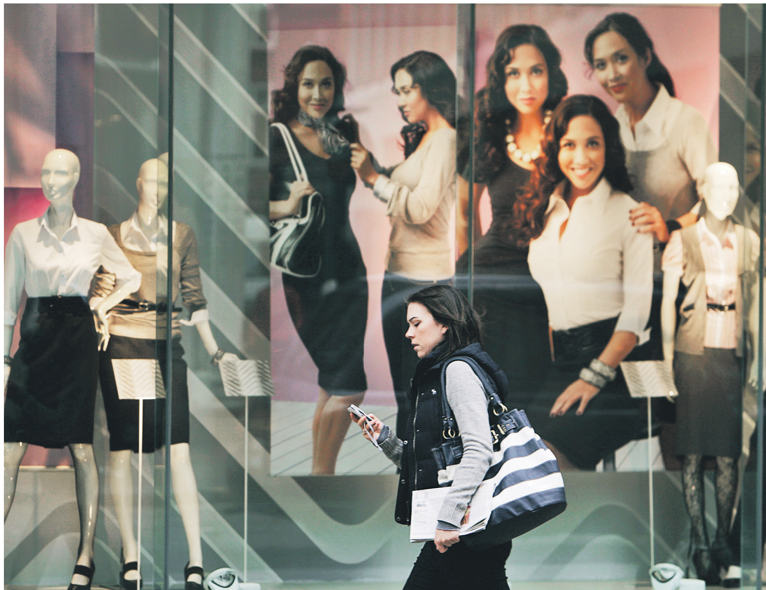
От $12 трлн до $28 трлн — на столько, по оценкам McKinsey, вырастет мировая экономика к 2025 году, если в корпорациях будет равное представительство полов

От публикаций на тему гендерного равенства, и журналистских и научных, часто веет борьбой за права угнетенных. Равенство и дискриминация, справедливость и предвзятость — расхожие термины в таких текстах. Но есть и иной резон в том, чтобы не только да-