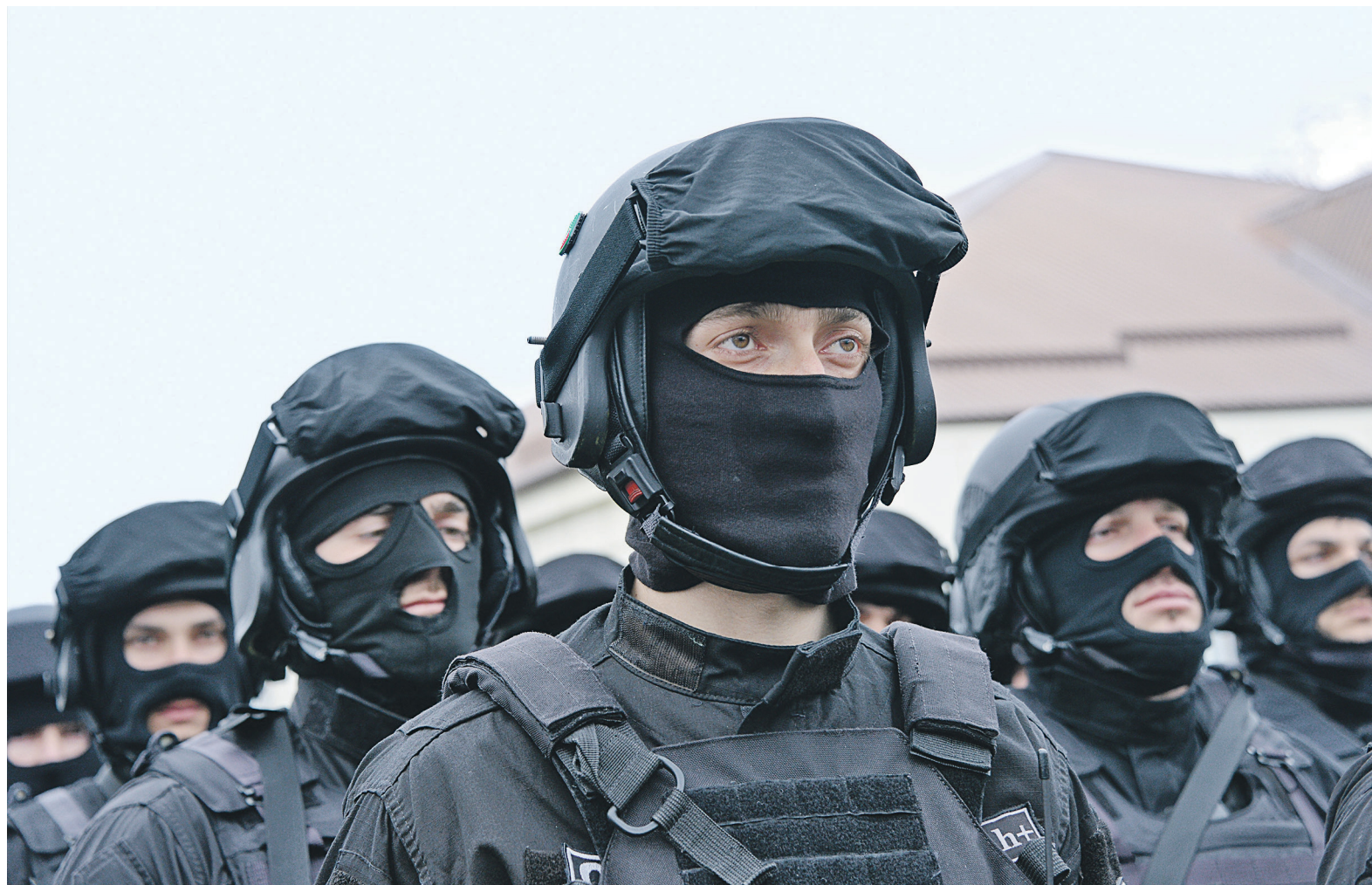
«То, что атакующие были уничтожены на месте, говорит о высокой подготовленности и профессионализме российских военнослужащих», — заявил РБК советник директора Росгвардии Александр Хинштейн

Услышав звуки стрельбы, один из рядовых части 15 минут пытался дозвониться до дежурно-