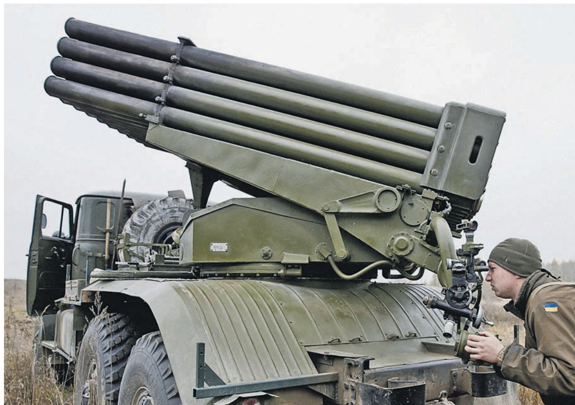
Во время действия военного положения командование может ограничивать свободу передвижения населения, проверять документы, грузы, жилье и запрещать проведение забастовок, собраний и митингов

Во время действия военного положения командование может ограничивать свободу передвижения населения, проверять документы, грузы, жилье и запрещать