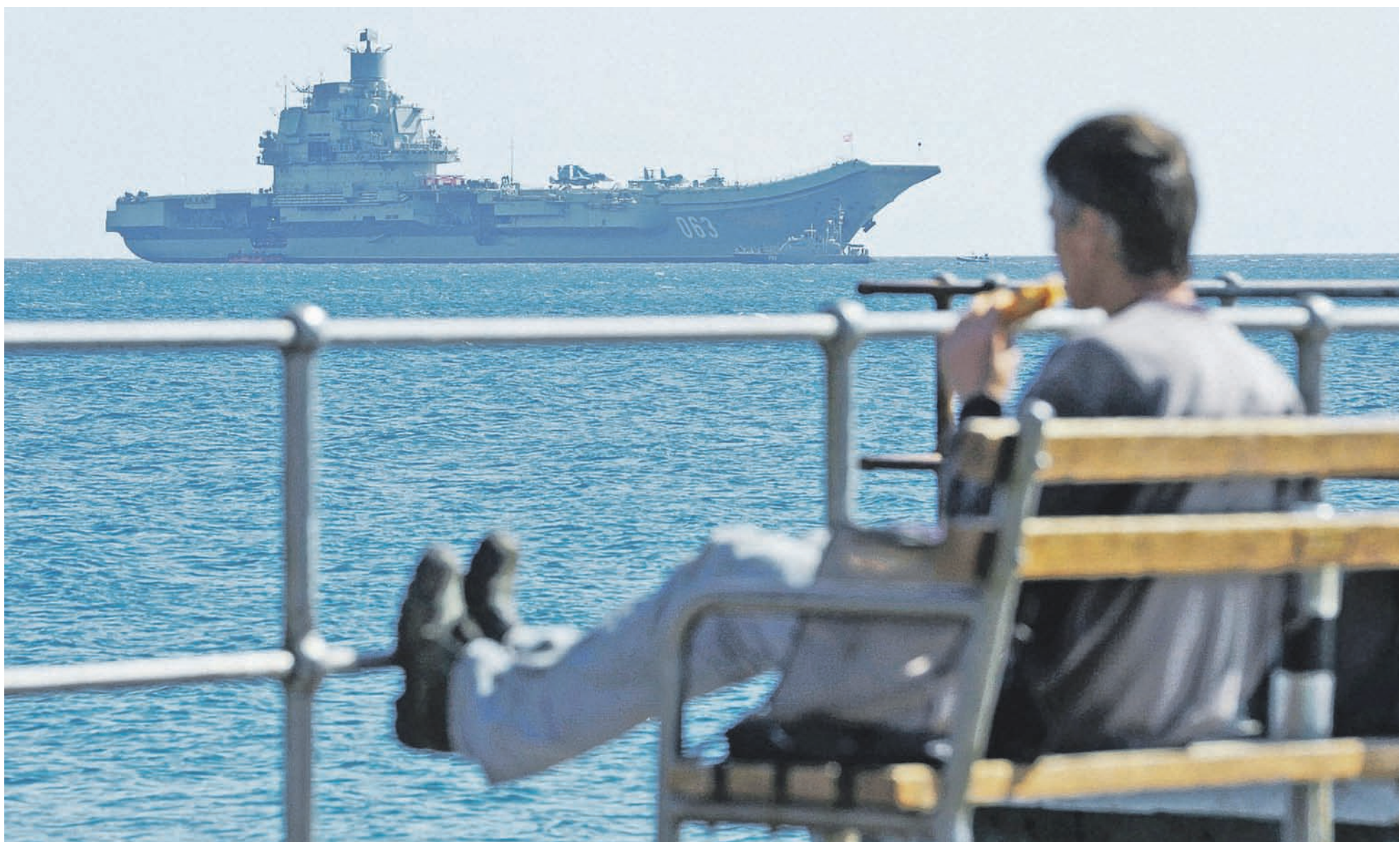
Морской путь от Североморска до побережья Сирии, который преодолел «Адмирал Кузнецов» вместе с остальной группой, составил 5,3 тыс. морских миль (более 9,8 тыс. км).

Сколько стоил поход «Адмирала Кузнецова» в Средиземное море