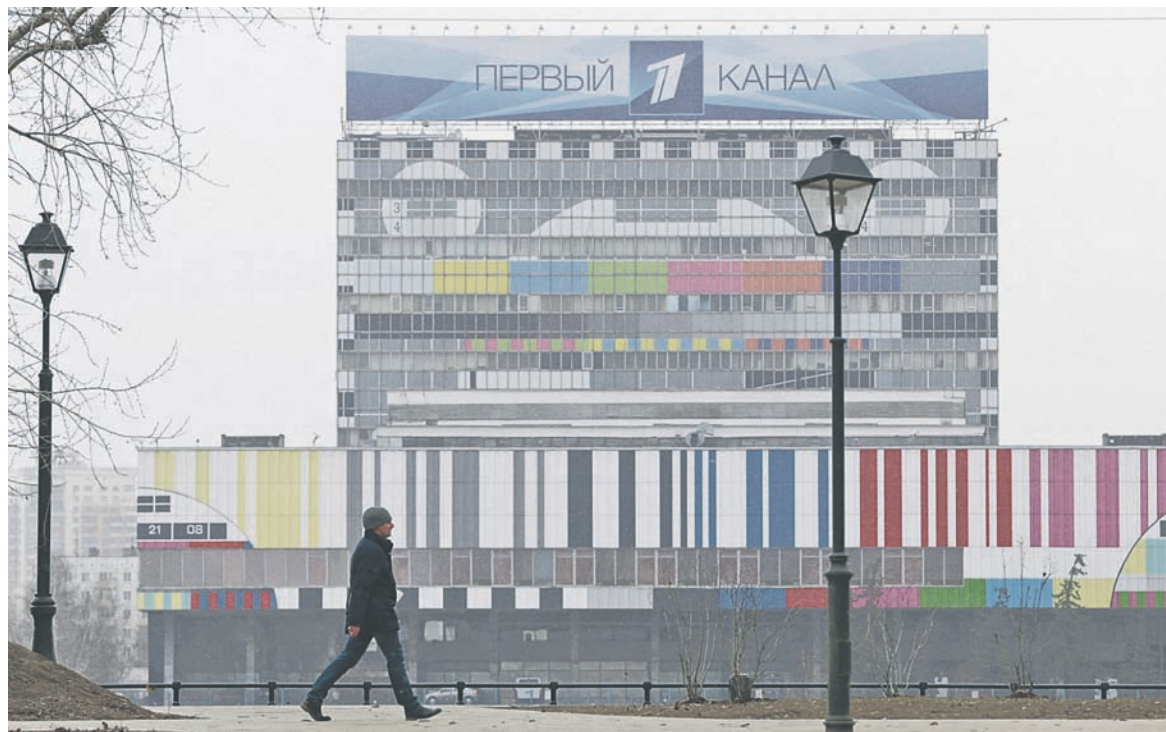
В 2016 году выручка «Первого канала» от рекламы в интернете выросла на 65%. Ожидается, что интеграция с телекоммуникационными компаниями даст прирост аудитории канала, что еще больше увеличит доходы от рекламы