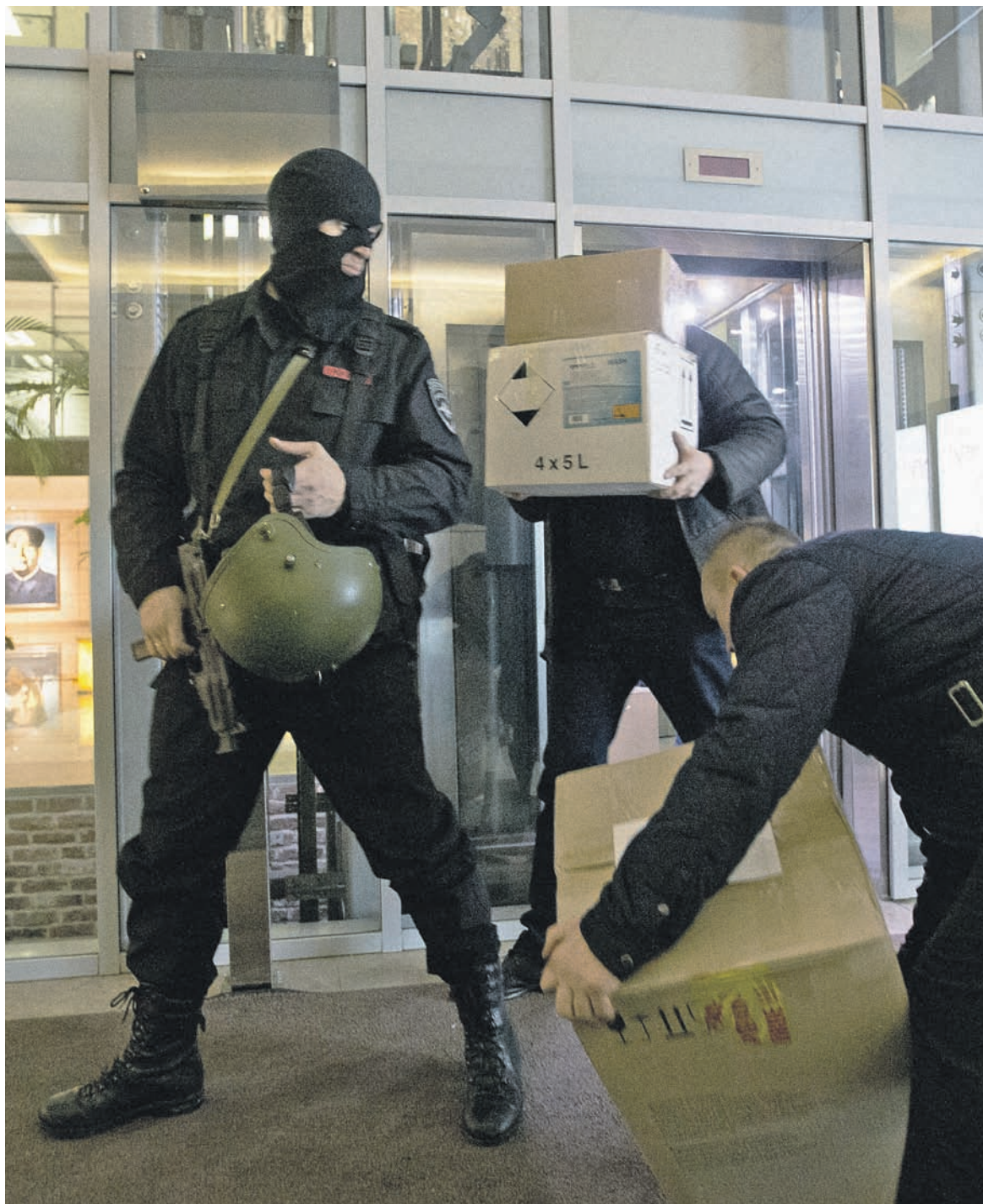
Среди рисков для бизнеса в России UC Rusal особо выделяет случаи уголовного преследования руководителей и акционеров компаний

Компания Дерипаски не в первый раз предупреждает инвесторов о рисках ведения бизнеса в России. Так, накануне размещения акций на Гонконгской бирже в декабре 2009 года она сообщала о риске перехода частных компаний из нефтегазовой, металлургической и других отраслей промышленности под контроль государства с использованием налоговых, природоохранных и других претензий. С тех пор несколько крупных компаний действительно перешли под контроль государства или госкомпаний: например, ТНК-