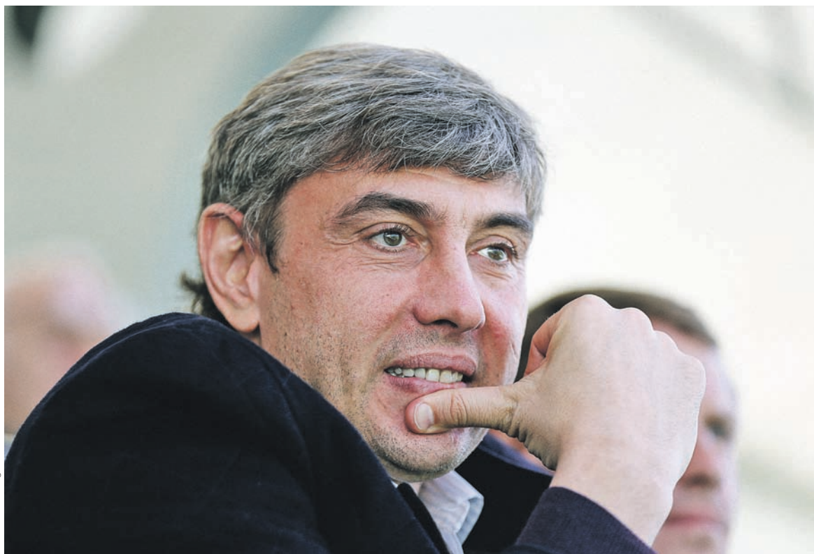
«Магнит» не первый раз попадает в число крупнейших поставщиков продовольствия. Например, в 2014 году компания Сергея Галицкого стала лидером по поставкам бананов в Россию с долей 21%

«Магнит» не первый раз попадает в число крупнейших поставщиков продовольствия. Как ранее писал РБК со ссылкой на данные