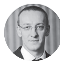
Александр Егоричев ФНС России