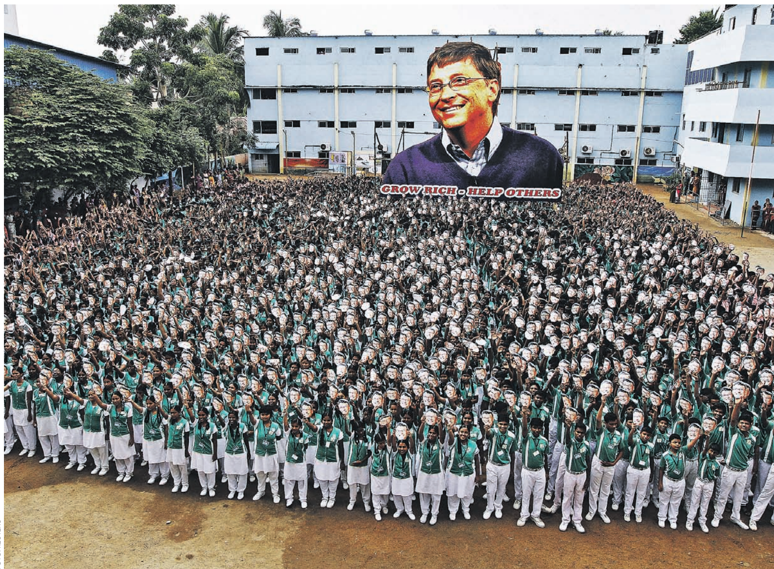
Кризис мировой экономики сделал богатейших людей мира еще богаче, причем увеличиваются капиталы миллиардеров на фоне роста глобальной бедности. На фото: индийские школьники держат портрет самого богатого человека планеты Билла Гейтса

Авторы доклада особо отмечают, что увеличение капиталов сверхсостоятельных людей происходит на фоне роста уровня глобальной бедности. По данным OXFAM, только за последний год доля беднейшей половины человечества в мировом богатстве сократилась почти вчетверо — с 0,7 до 0,2%. Примерно 10% человечества живут сейчас менее чем на $1,9 в день, каждый девятый человек в мире голодает, а около 3 млрд человек находятся за так называемой этической чертой бедности, то есть не имеют дохода, минимально необходимого для обе-