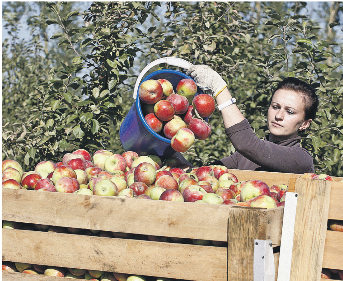
Господдержка производителям сидра будет выражаться в предоставлении преференций в правовом регулировании производства и оборота напитка, а также льготном кредитовании

Лоббировать признание сидра сельхозпродуктом производители во главе с ассоциацией «Опора России» начали с лета 2014 года, ссылаясь на то, что соответствующий статус получило вино. Но если виноград растет всего в нескольких регионах на юге России, то яблони — почти по всей стране, поясняли авторы инициативы. Ни Минсельхоз, ни Минэкономраз-