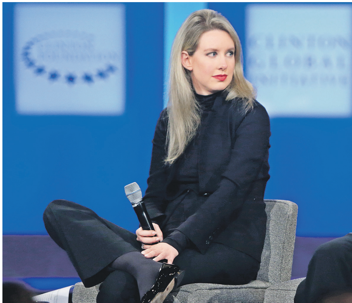
Элизабет Холмс, создательницу стартапа Theranos, называли «новым Джобсом» и самой молодой женщиной-миллиардером, но лишь до тех пор, пока ее компанию не заподозрили в мошенничестве

В итоге скорость, с которой стартапы набивают себе цену «на бумаге», возродила разговоры о пузыре на рынке технологий с новой силой. В 2015 году с программным текстом об угрозе «нашествия единорогов» на сайте Above the Crowd выступил влиятельный инвестор, партнер фонда Benchmark Билл Герли. По его мнению, в погоне за the next big thing (в переводе — «следующая большая вещь») инвесторы недостаточно качественно проводят аудит стартапов, а те, в свою очередь, либо намеренно манипулируют финансовыми показателями и скрывают отсутствие эффективной бизнес-модели, либо сами не до конца понимают экономику своего бизнеса. Инвесторы, уже поспешившие с вложениями в переоцененные компании, по спирали тянут за собой остальных, раздувая этот пузырь, отмечал Герли.