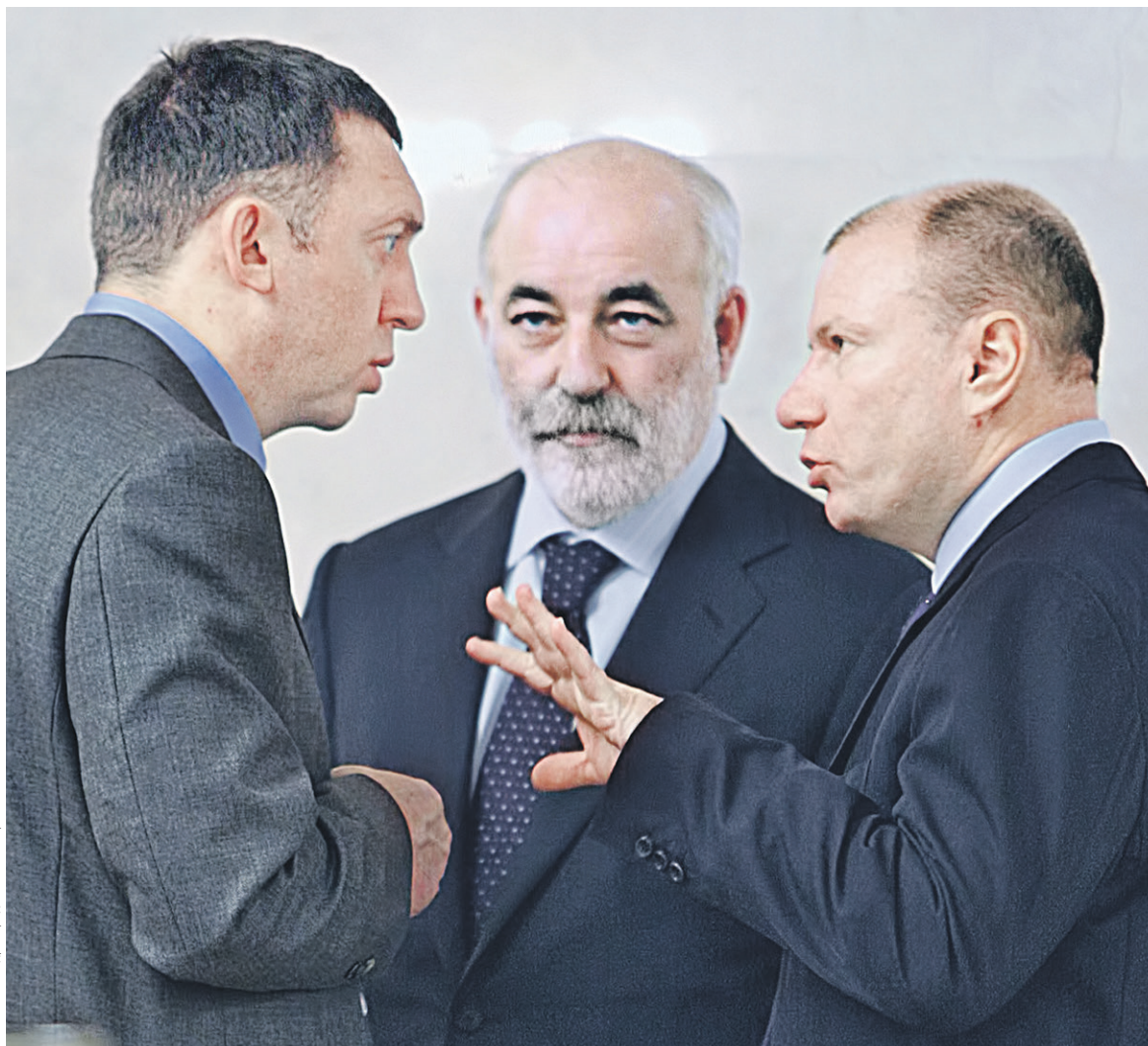
На троих Олег Дерипаска, Виктор Вексельберг и Владимир Потанин (слева направо) смогут реструктурировать больше 120 млрд руб. долгов ВЭБу