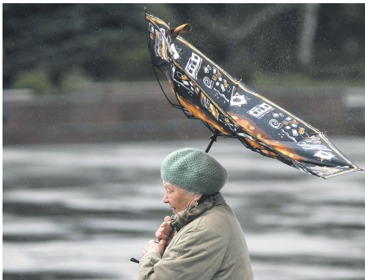
В 2016 году пенсии россиянам были проиндексированы лишь на 4%, что втрое ниже фактической инфляции 2015 года

В 2016 году пенсии россиянам были проиндексированы лишь на