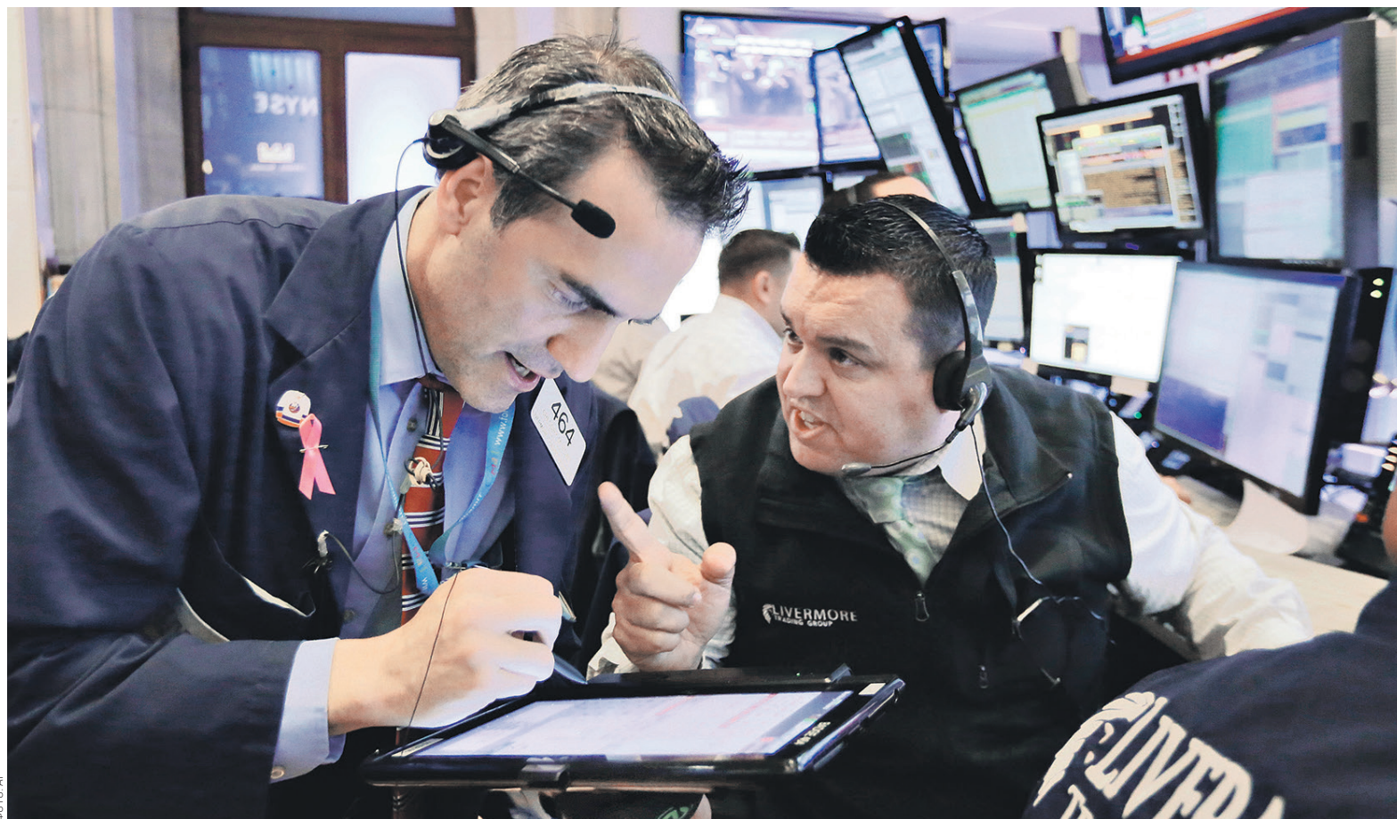
Для рисков усиления инфляции в США после избрания Дональда Трампа новым президентом придумали термин «трампфляция»

Доходность десятилетних гособлигаций США по итогам торгов в четверг, 10 ноября, выросла с нача-