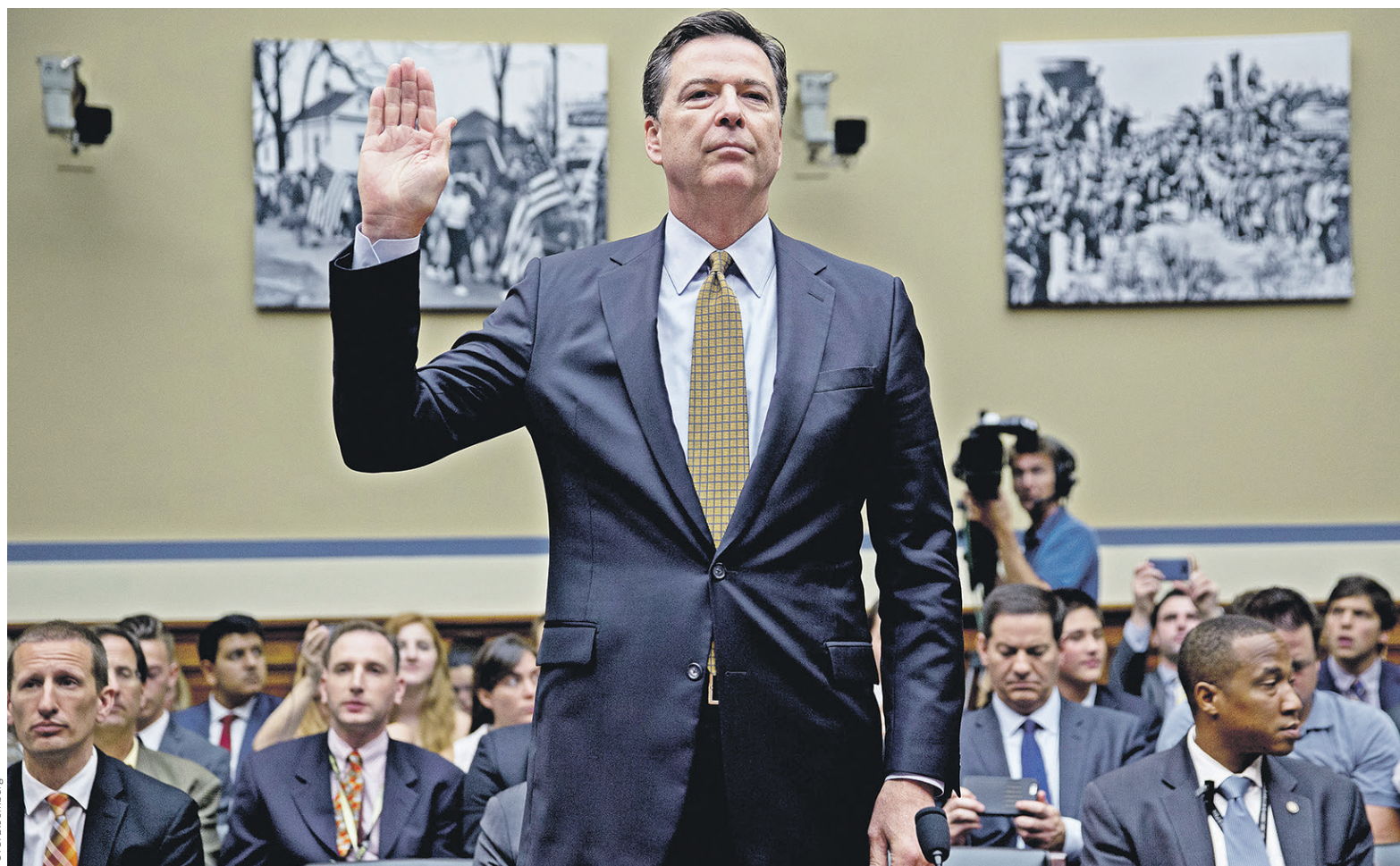
По мнению Хиллари Клинтон, «переломным моментом» в предвыборной гонке стало письмо главы ФБР Джеймса Коми конгрессу, поднимающее тему ее вскрытой переписки

Клинтон также отметила, что после третьего, финального раунда дебатов с Трампом, который состоялся 20 октября, была уверена в