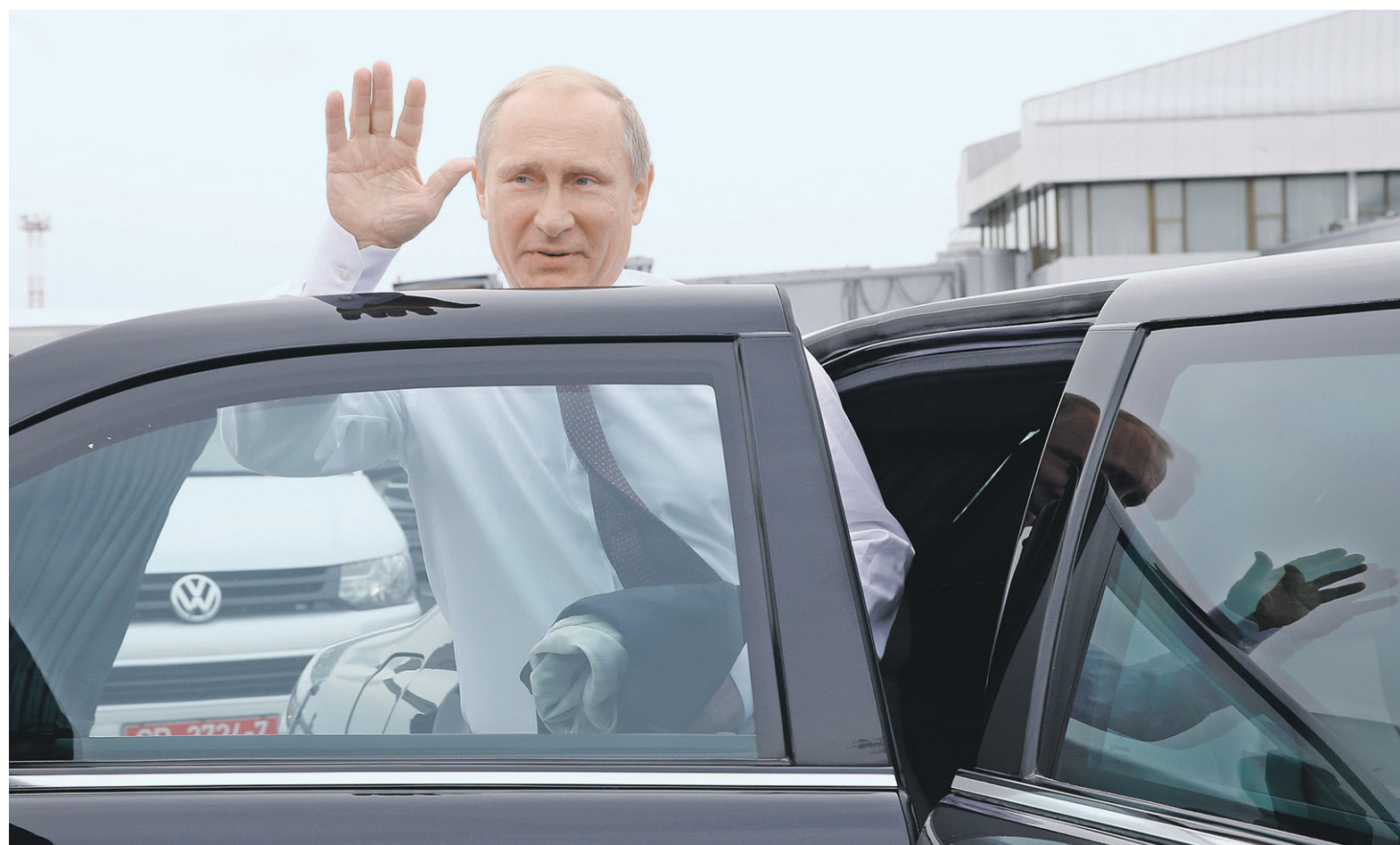
Причины отмены всех мероприятий с участием Владимира Путина не сообщаются, его пресс-секретарь заявил, что поездки президента и не были окончательно запланированы