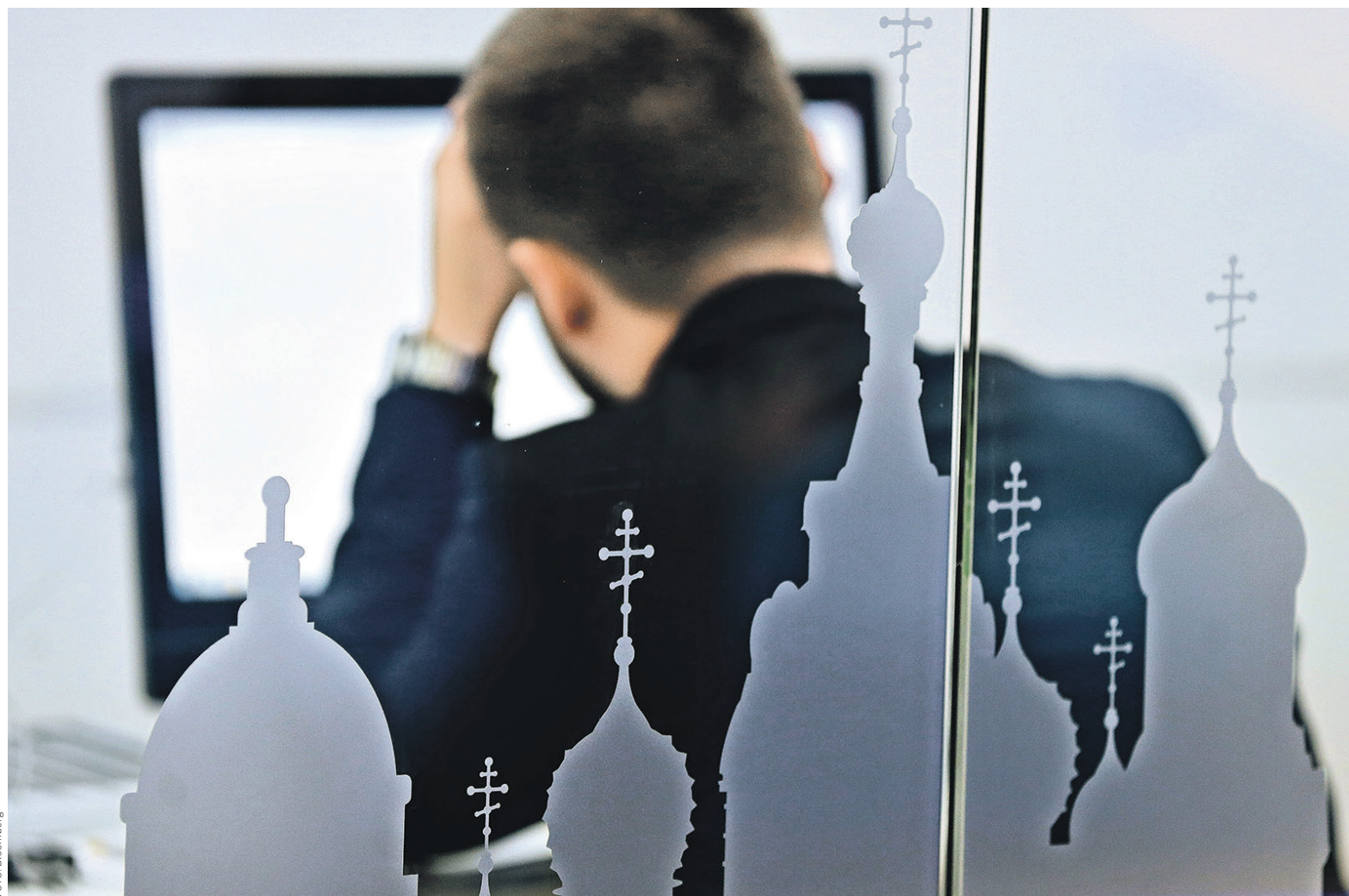
Уже два года чиновники боятся, что Рунет в любой момент может быть отрезан от глобальной Сети